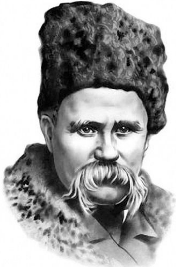
Тарас Шевченко (1814—1861)