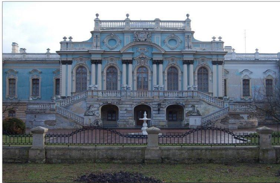
Маринский дворец 21.01.2007