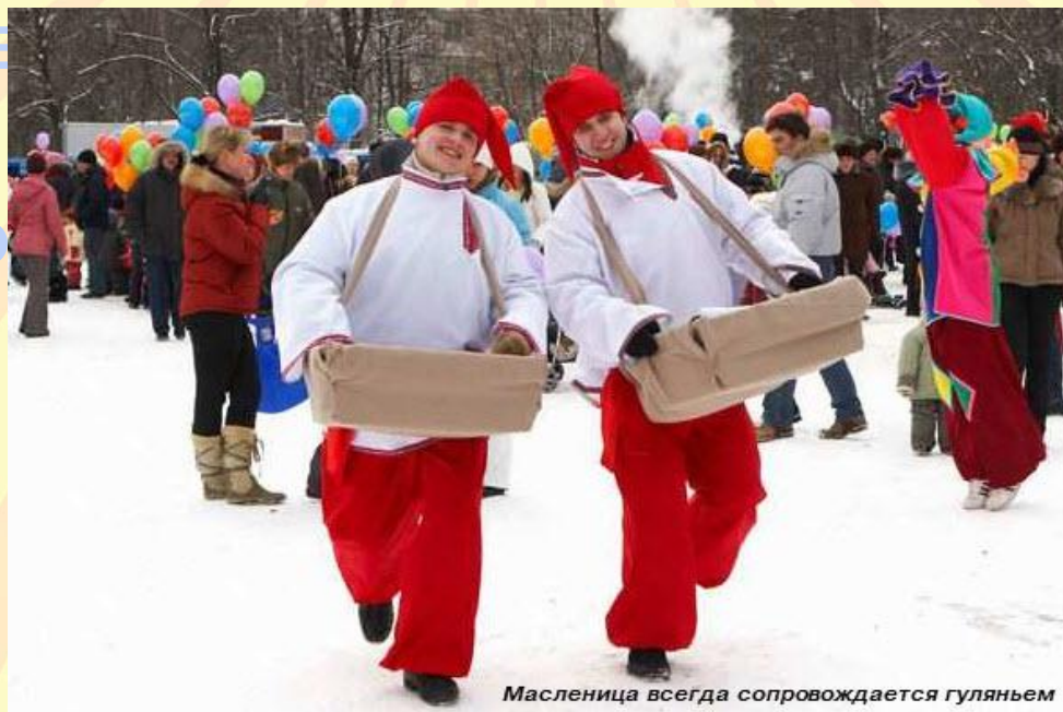
Масленица всегда сопровождается гуляньем

ЧЕТВЕРГ – разгул. В это день начиналось настоящее масленичное гулянье, недаром этот день назывался «широким». Люди разв орили крепос ые бои.