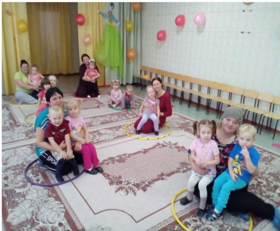
Подвижная игра «Гнездышко»