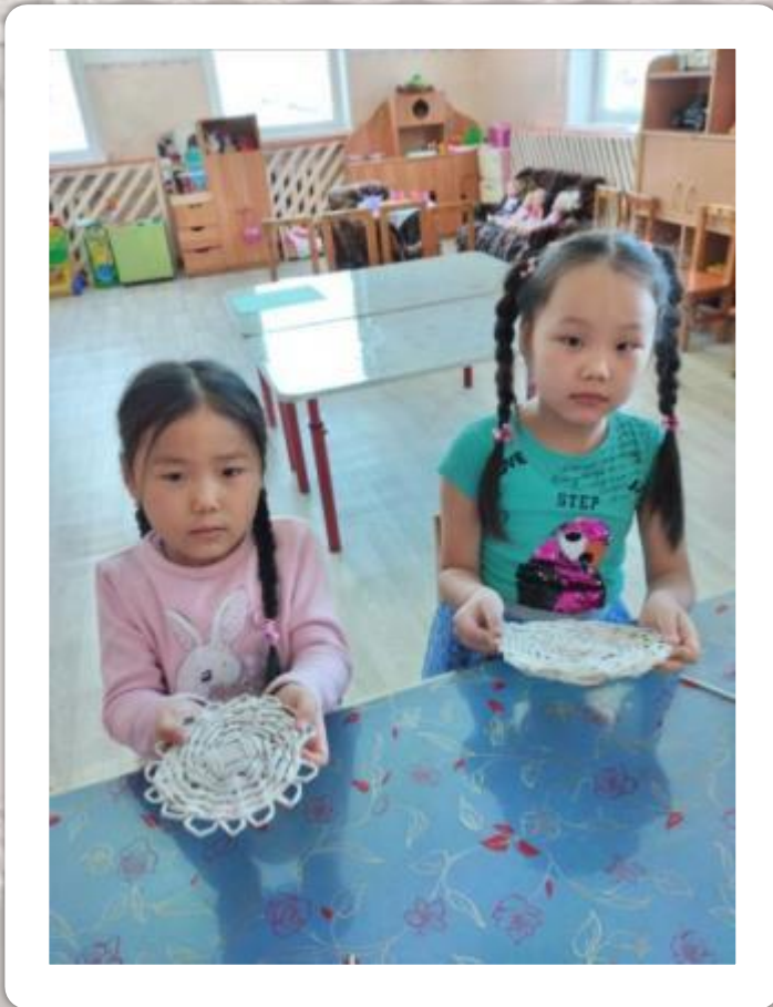
Готовые работы детей