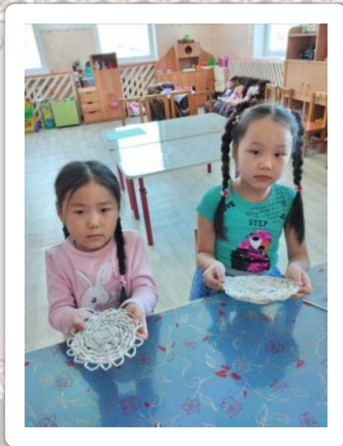
Готовые работы детей