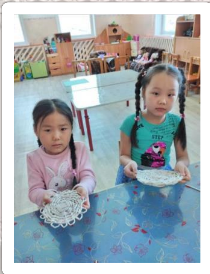
Готовые работы детей