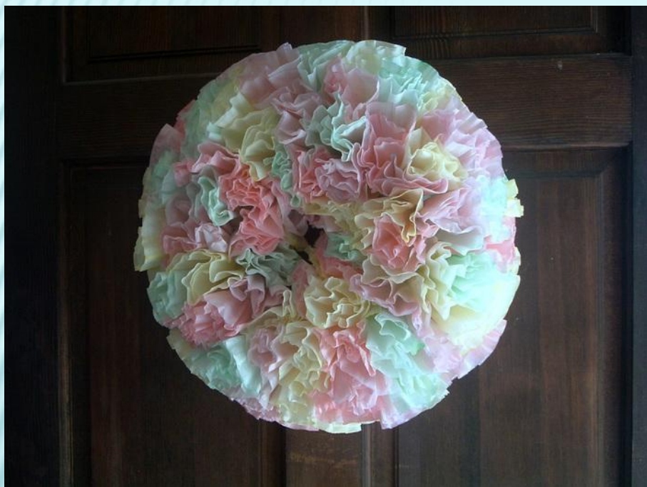
НЕЖНАЯ КОМПОЗИЦИЯ «ЦВЕТОК-ВЕНОК»