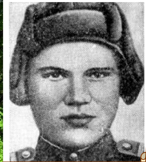
Пешехонов Василий Иванович