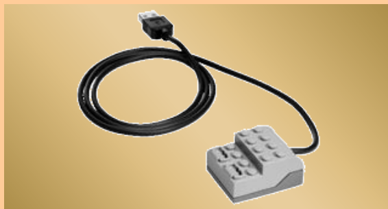
USB хаб WeDo