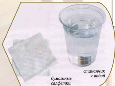
Стакан с водой