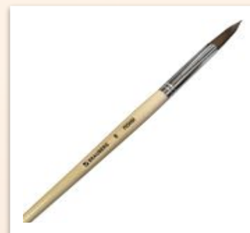
Кисть для смачивания