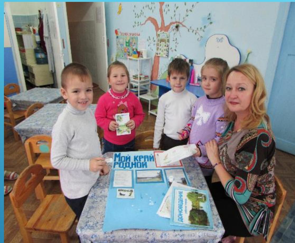
ИЗГОТОВЛЕНИЕ СТЕНДА «МОЙ РОДНОЙ КРАЙ»