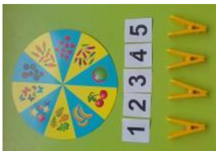
Дидактическая игра «Умные прищепки»