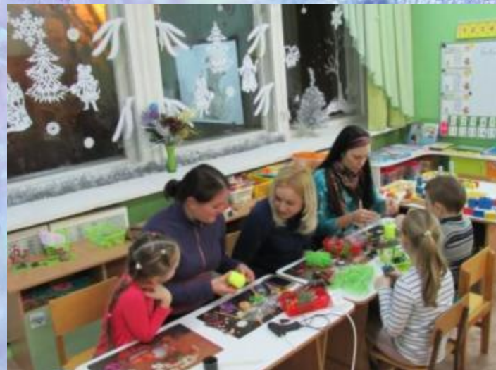
Совместный творческий процесс