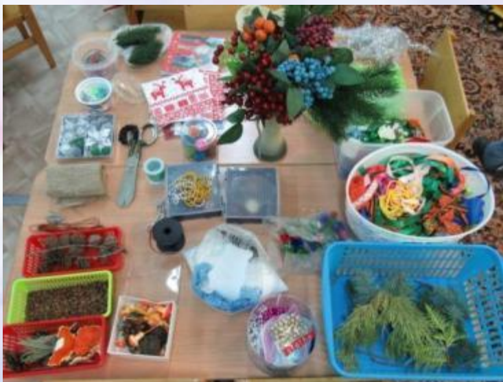
Природный и бросовый материал для декорирования свечи