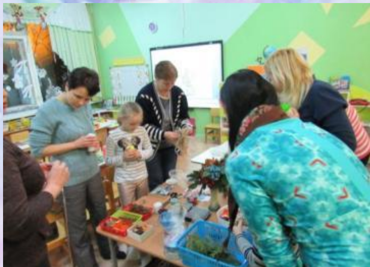
Начало творческого пути