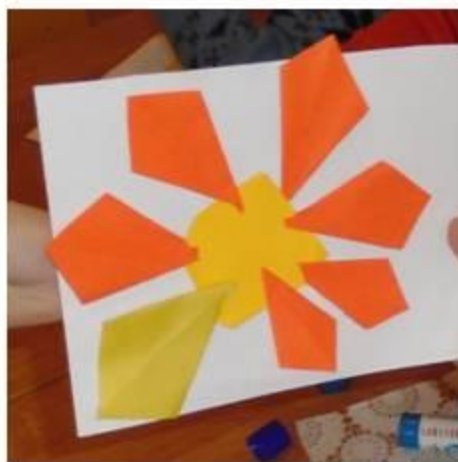
«Блинчик» «Воздушный змей»