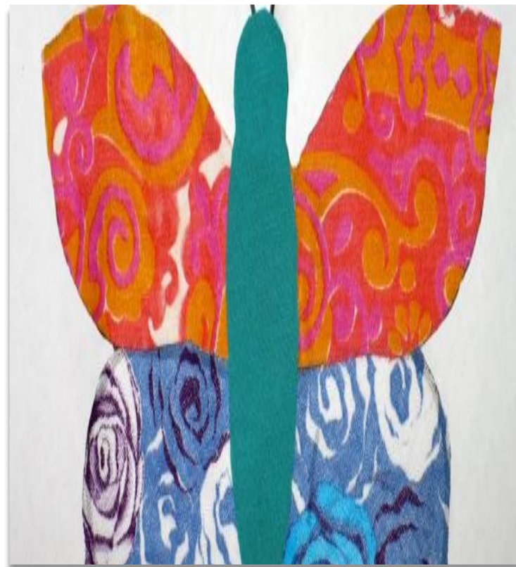
Аппликация из ткани