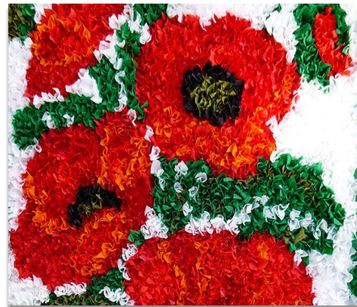
Аппликация в технике торцевание