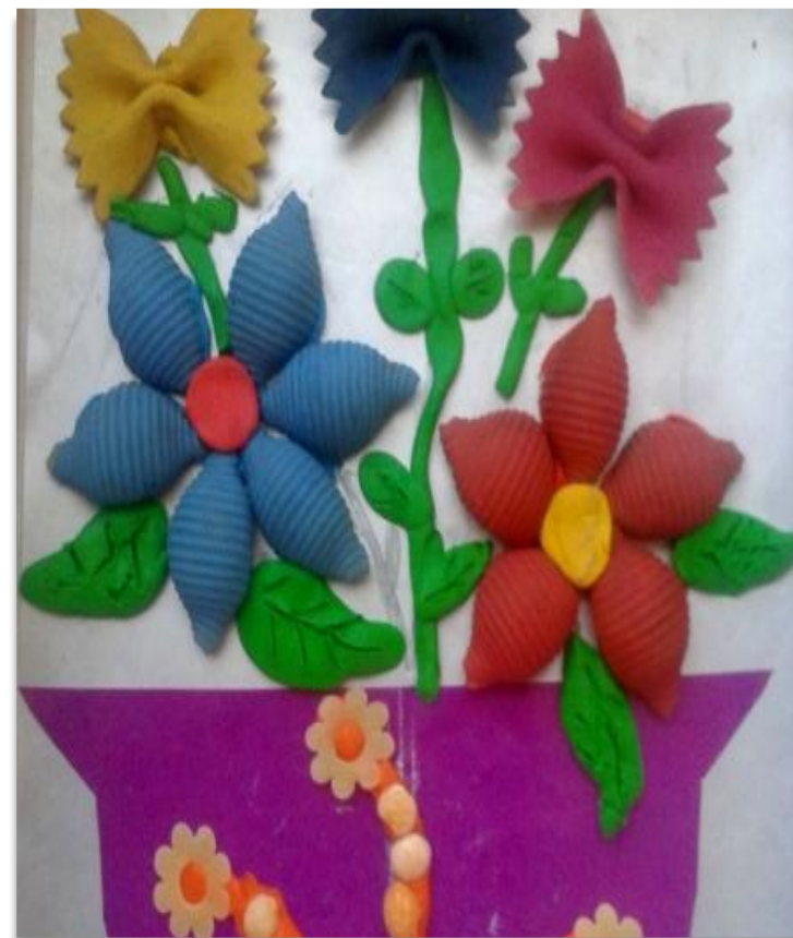
Аппликация из макаронных изделий