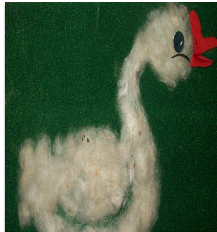
Аппликация из ваты