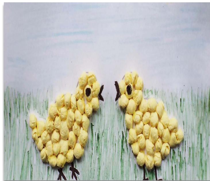
Аппликация в технике скатывания