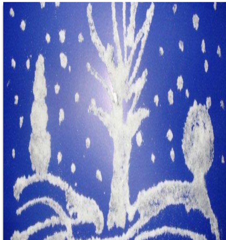
Аппликация из соли