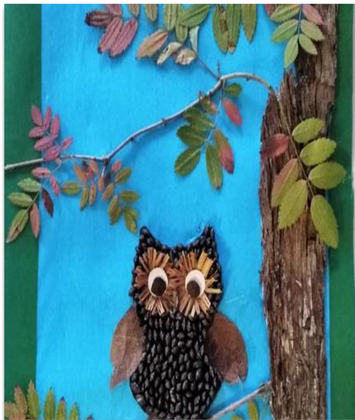
Аппликация из природного материала