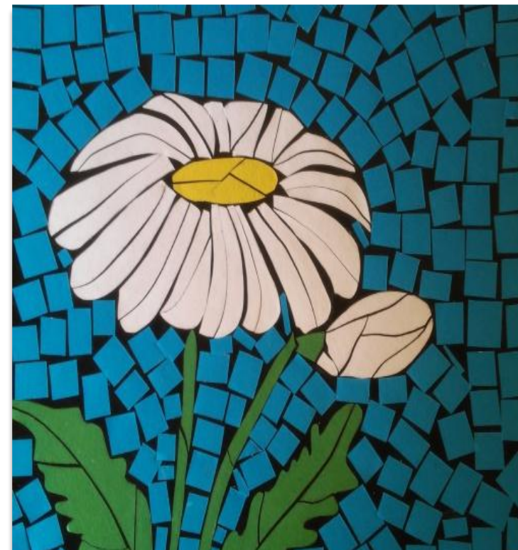
Аппликация в технике мозаика