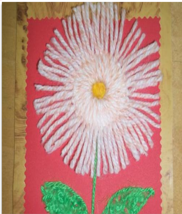
Аппликация из шерстяных ниток