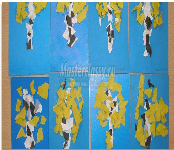
Аппликация в технике обрывание