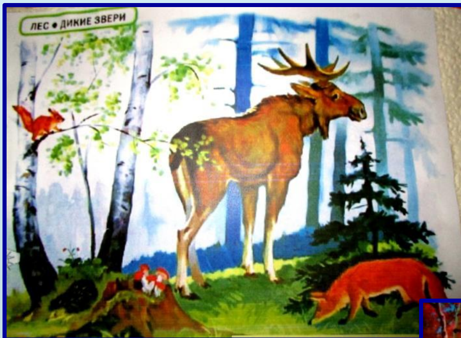
Иллюстрация «Дикие звери»

Цель: Систематизировать знания детей о диких животных