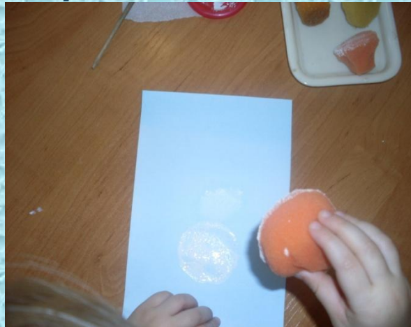
Печатки из поролон