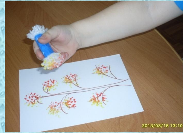
Рисование тычком (сетка для фруктов)