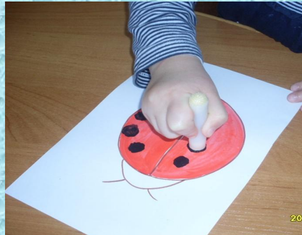
Поролоновый тычок (малый)