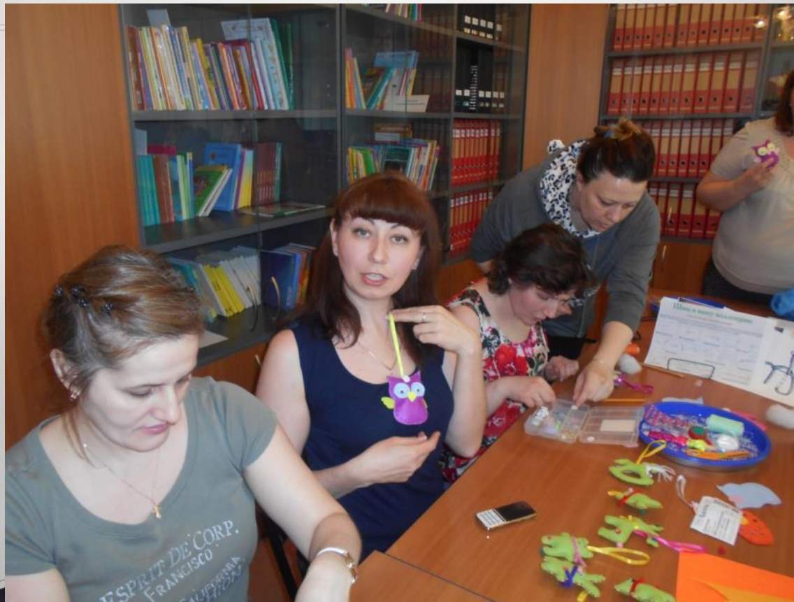
ФОТО С ГОТОВОЙ РАБОТОЙ. ЗАЙМЁМСЯ УКРАЩАТЕЛЬСТВОМ!