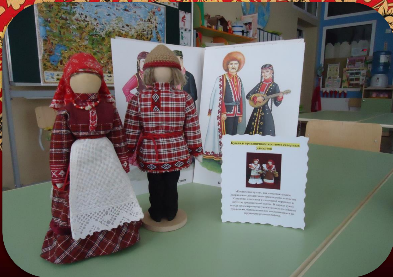
Кукла в праздничном костюме северных удмуртов