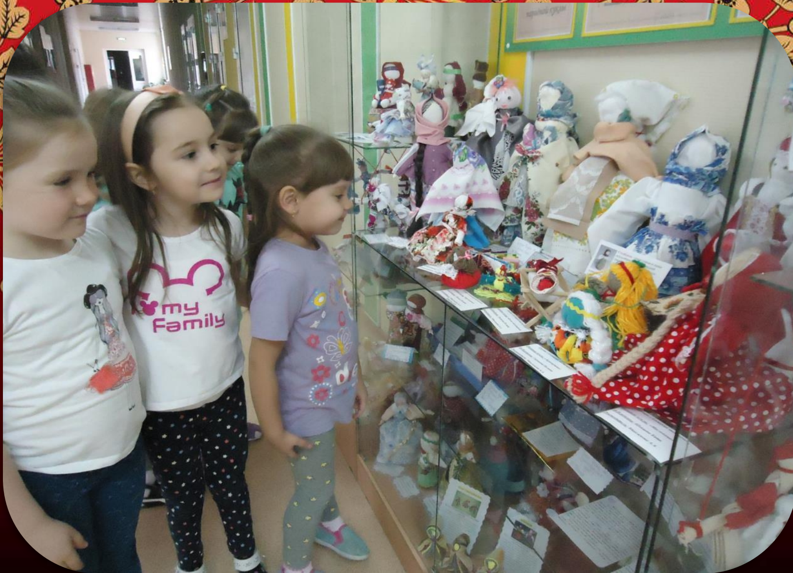
Посещение выставки в МБДОУ №2 «Народная кукла»