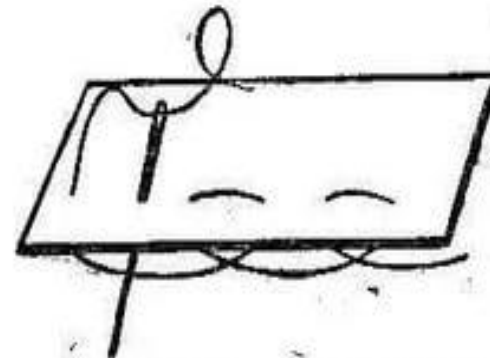
Рис. 2. Шов „за иголку“