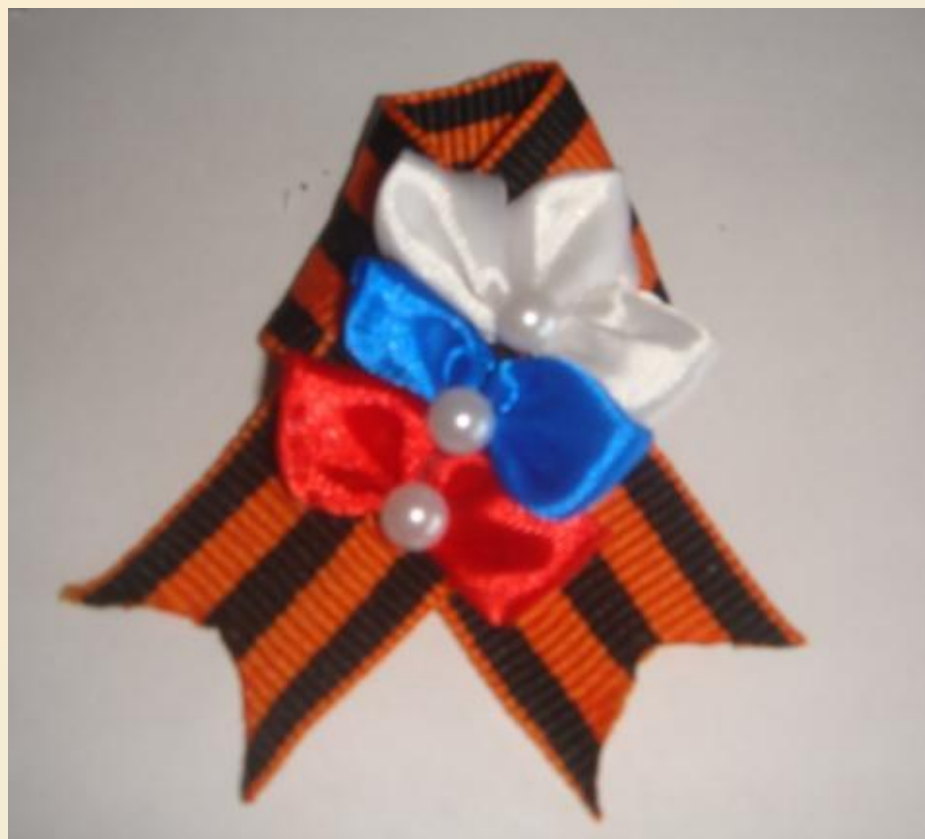
Значок к 9 мая в технике канзаши