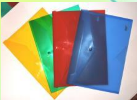
Папка для бумаг