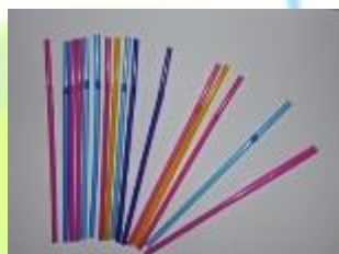
Трубочки для коктейля