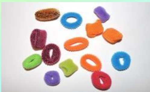
Резинки для волос