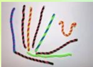
Резинки для волос