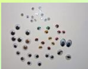
Глазки на клейкой основе