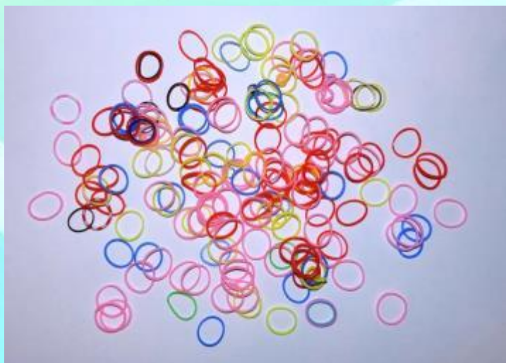
Резинки для плетения