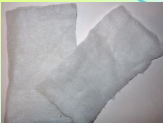
Синтепон или вата