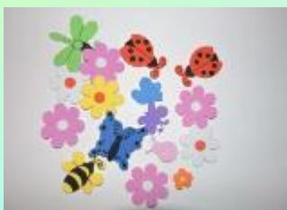
Резинки для волос