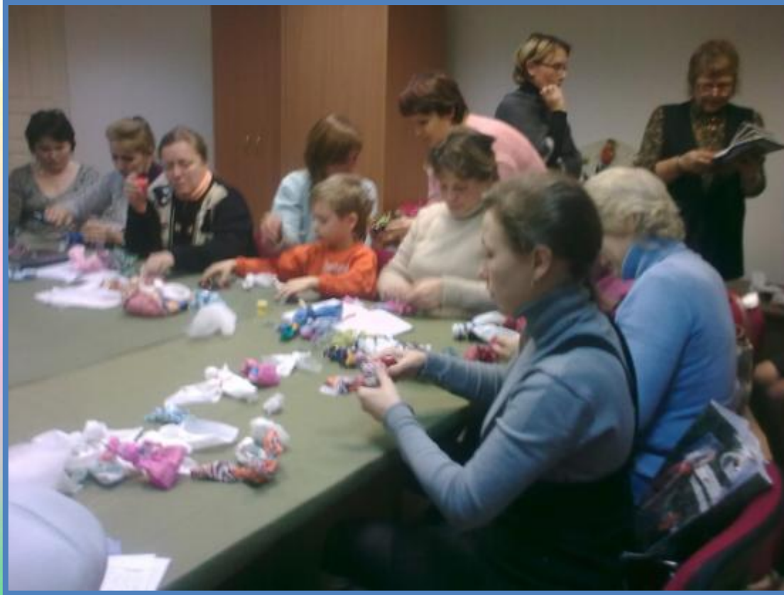
Семинар «Лоскутная слобода»