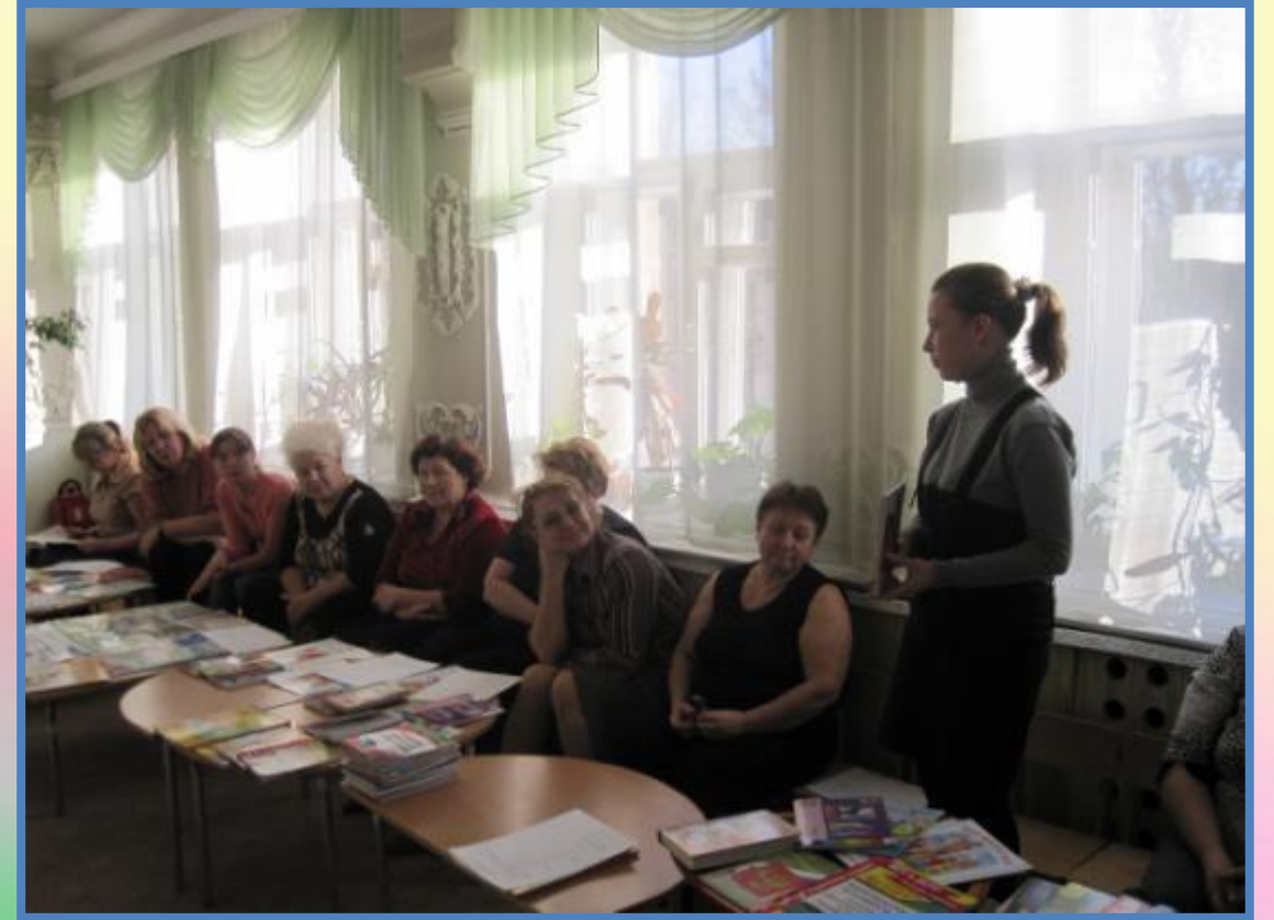
Выступления на педагогических советах