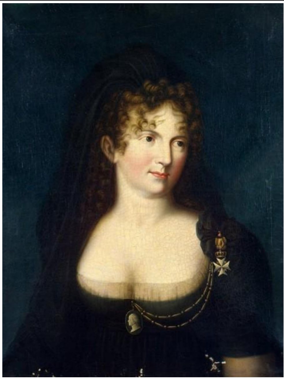
Ампир. Первая половина XIX в., неизвестный художник. Портрет имп. Марии Фёдоровны.