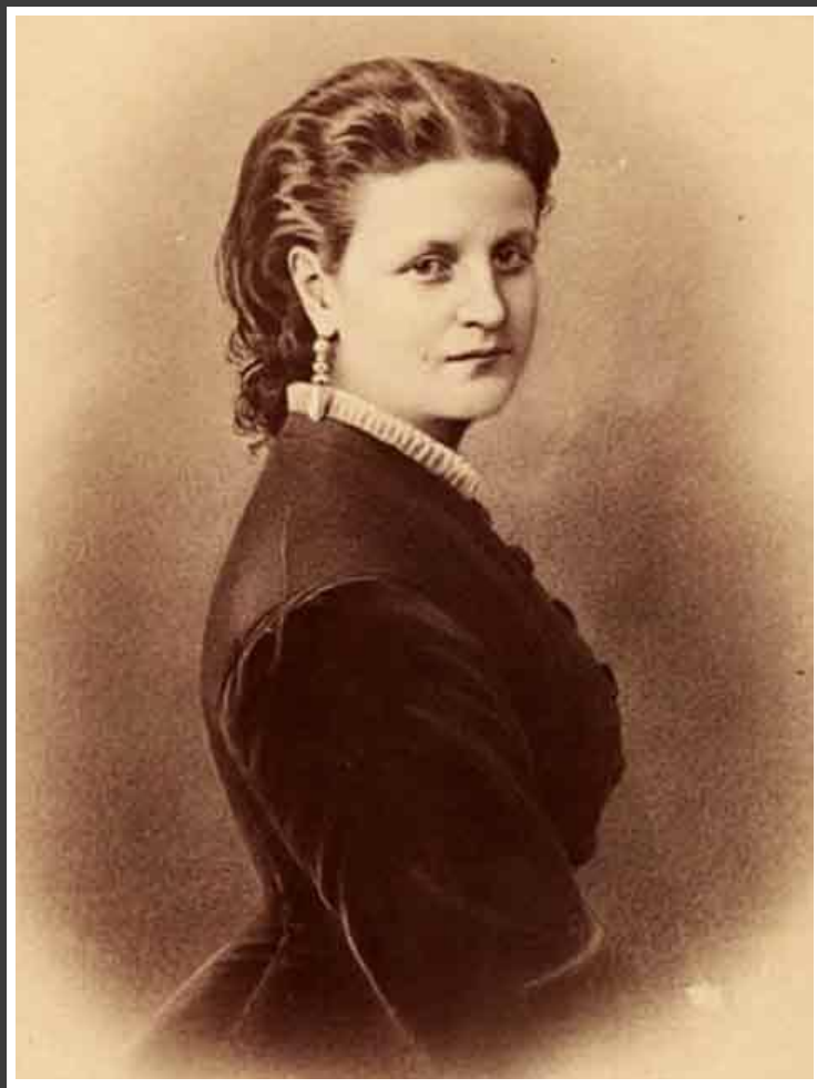
Екатерина Михайловна герцогиня Мекленбург-Стрелицкая. (1827-1894)