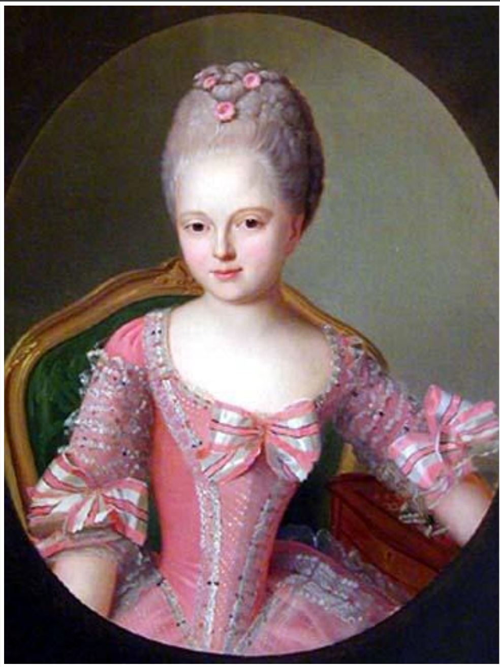
Рококо. XVIII век. София Доротея Вюртемберг (1759-1776), будущая императрица Мария Федоровна.