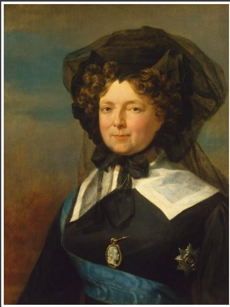
Портрет имп. Марии Фёдоровны в трауре. Между 1825 и 1827., Д.Доу.