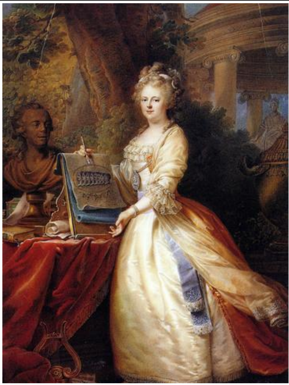
Неоклассицизм. Иоганн Баптист Лампи. Портрет великой княгини Марии Федоровны. 1795. Музей-заповедник «Павловск». 1795г.