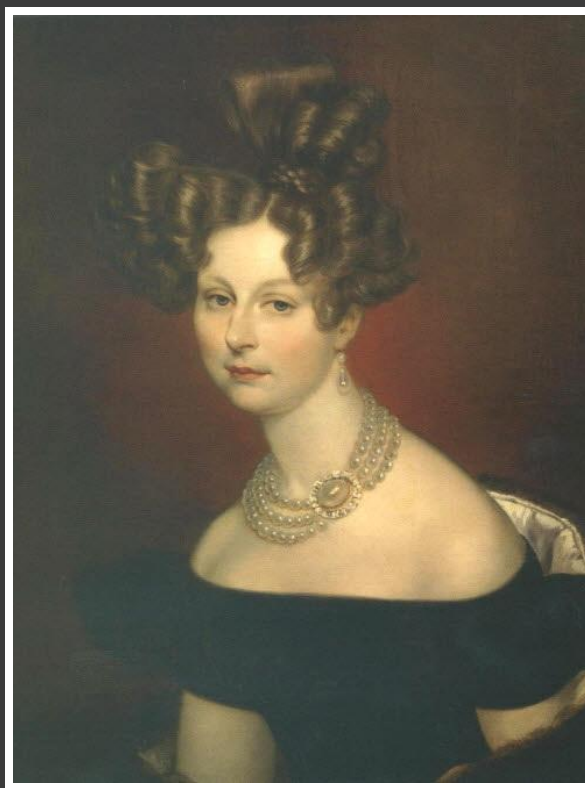
Елена Павловна- русская великая княгиня