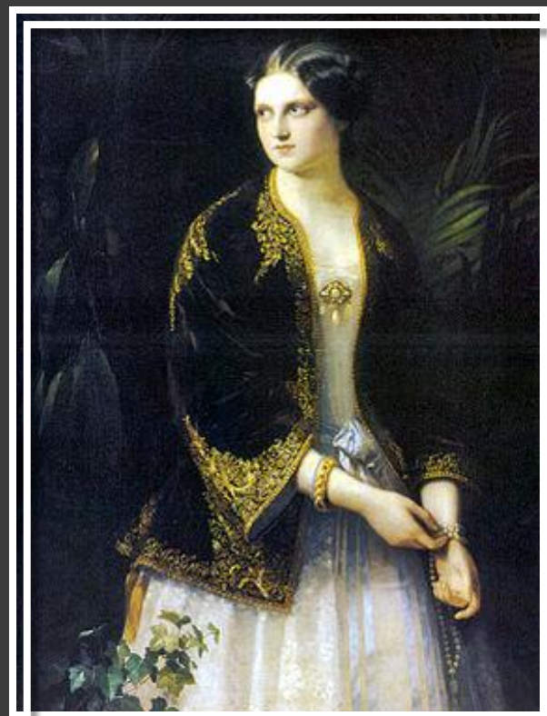
Екатерина Михайловна- герцогиня Мекленбург- Стрелицкая