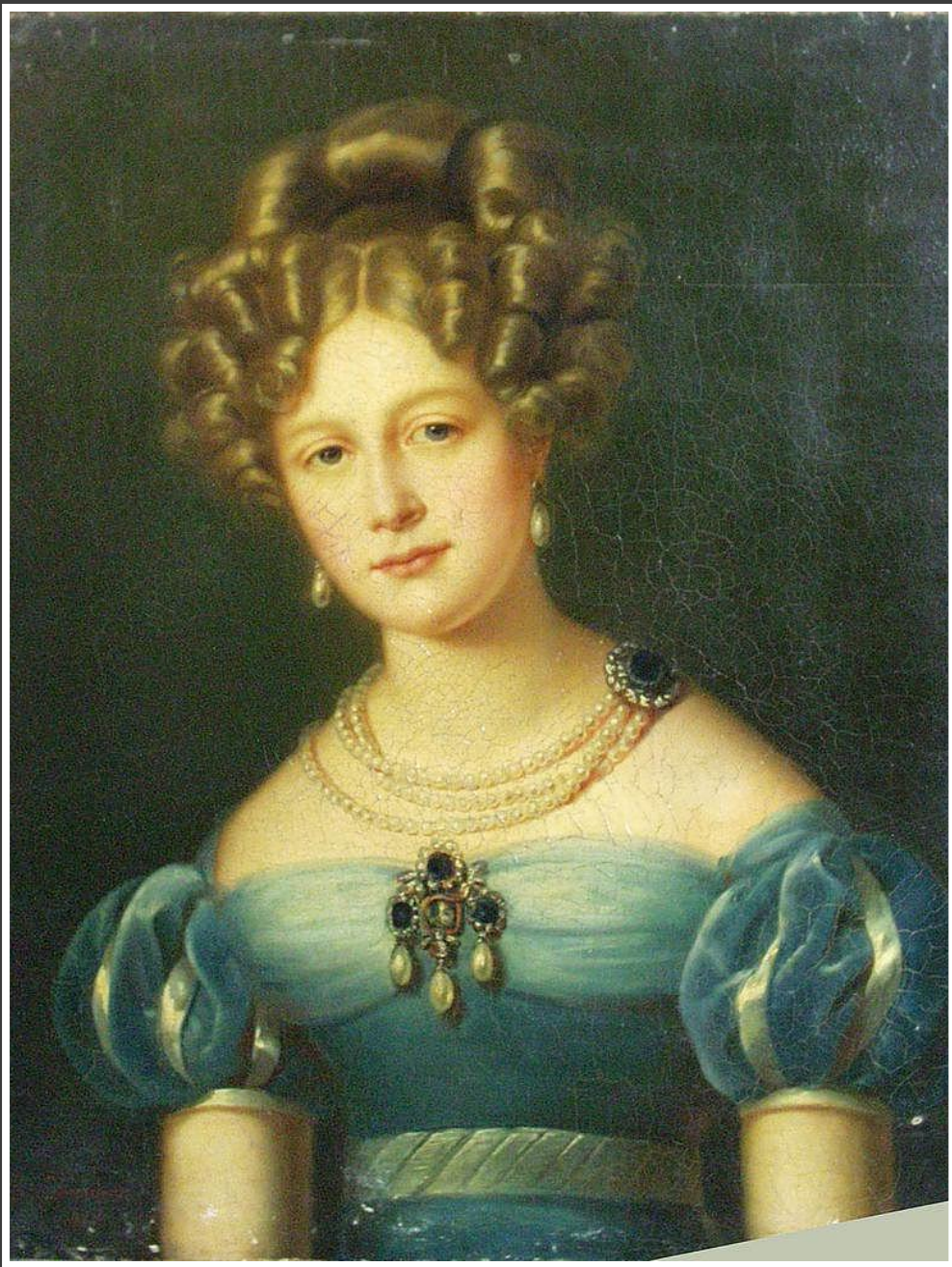
Романтизм. XIX в. 1824 г. С. Шерадам. Портрет Елены Павловны.