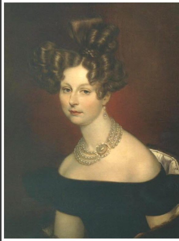
Елена Павловна- русская великая княгиня