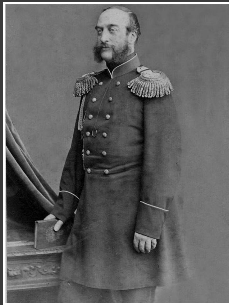
Супруг герцог Георг-Август-Эрнест- Адольф-Карл-Людвиг Мекленбург- Стрелицкий. (1824-1876)