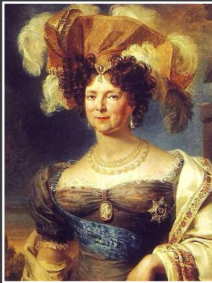
Романтизм. XIX в. Доу Д. Портрет императрицы Марии Фёдоровны.