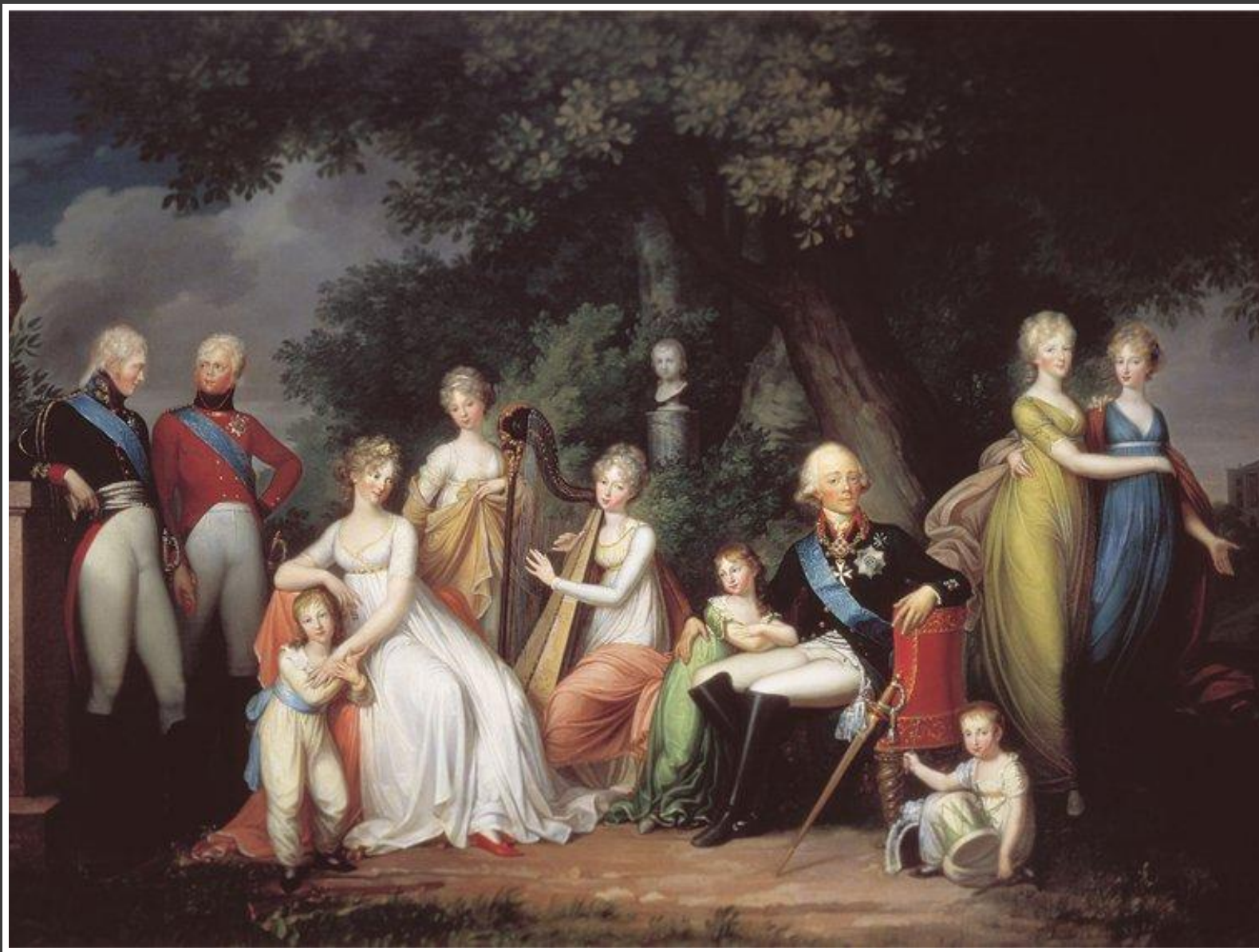
Император Павел I со своей семьей. Г.Кюгельген, 1800 г.