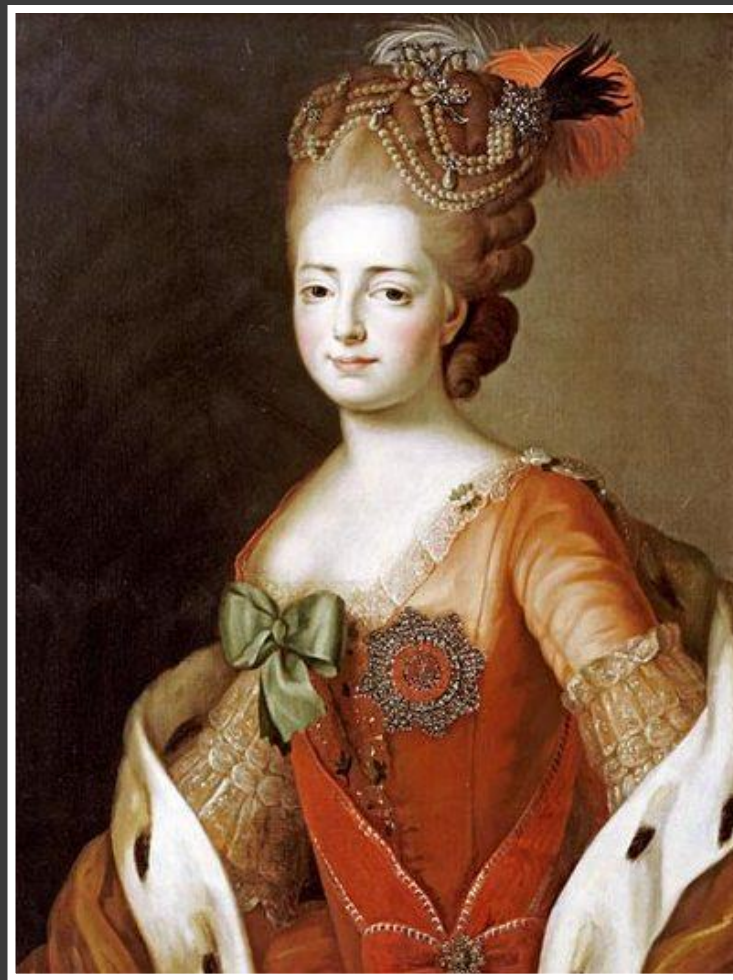
Великая княгиня Мария Федоровна