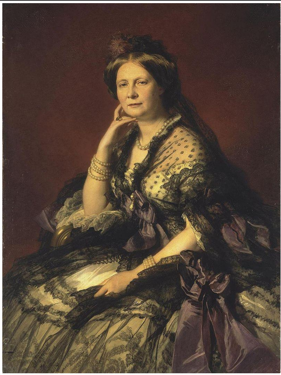
«Второе рококо» . 1862 г. Портрет великой княгини Елены Павловны. Франсуа Ксавье.