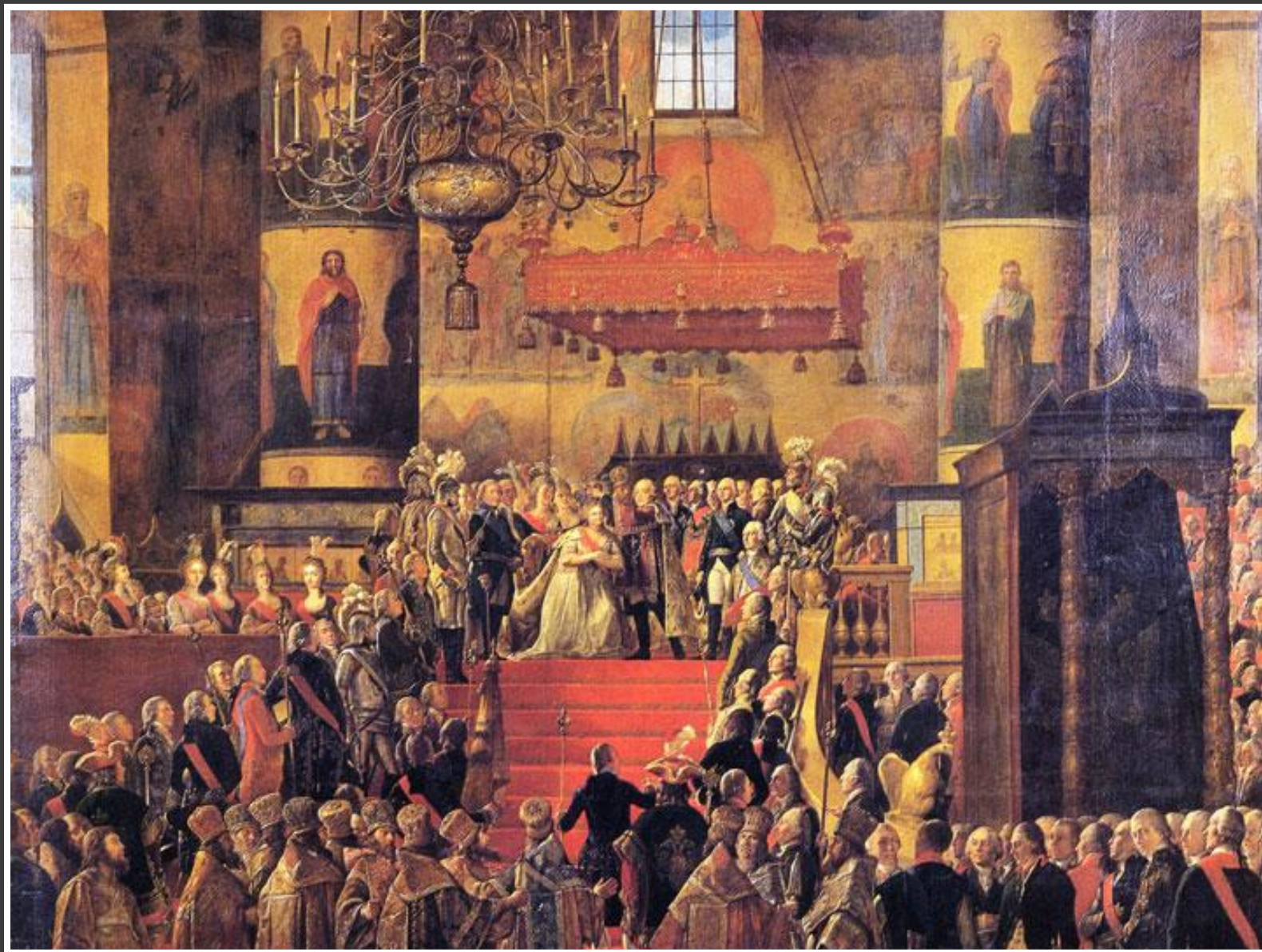
Мартин Фердинанд Квадаль. «Коронация Павла I и Марии Федоровны».