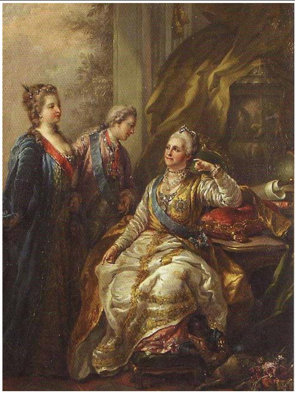
«Великий князь Павел Петрович представляет императрице Екатерине II свою невесту, будущую великую княгиню Марию Федоровну». С. Торелли, 1776г.