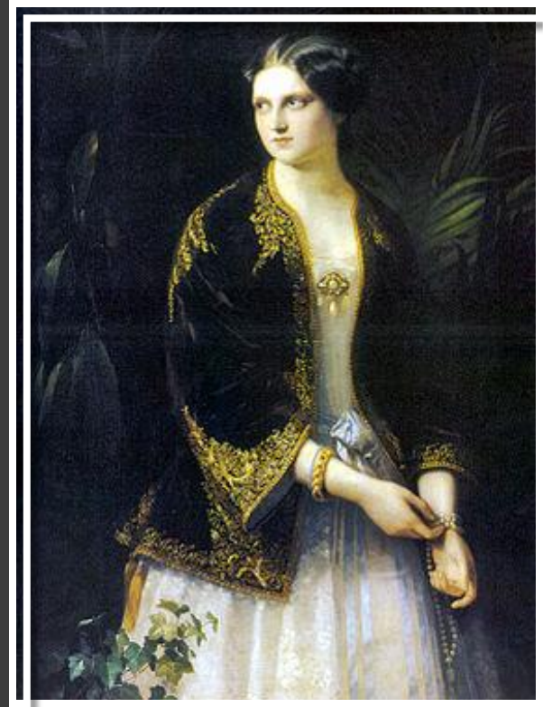
Екатерина Михайловна- герцогиня Мекленбург- Стрелицкая