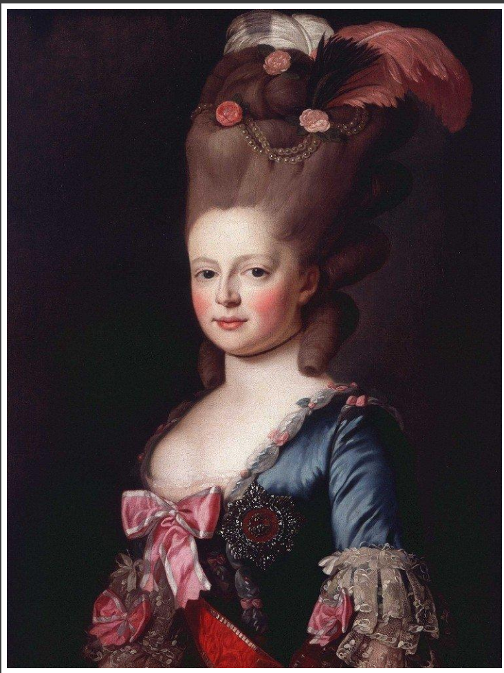
А. Рослин. Портрет Великой княгини Марии Федоровны. ок.1777 г.