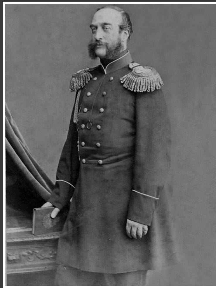
Супруг герцог Георг-Август-Эрнест- Адольф-Карл-Людвиг Мекленбург- Стрелицкий. (1824-1876)