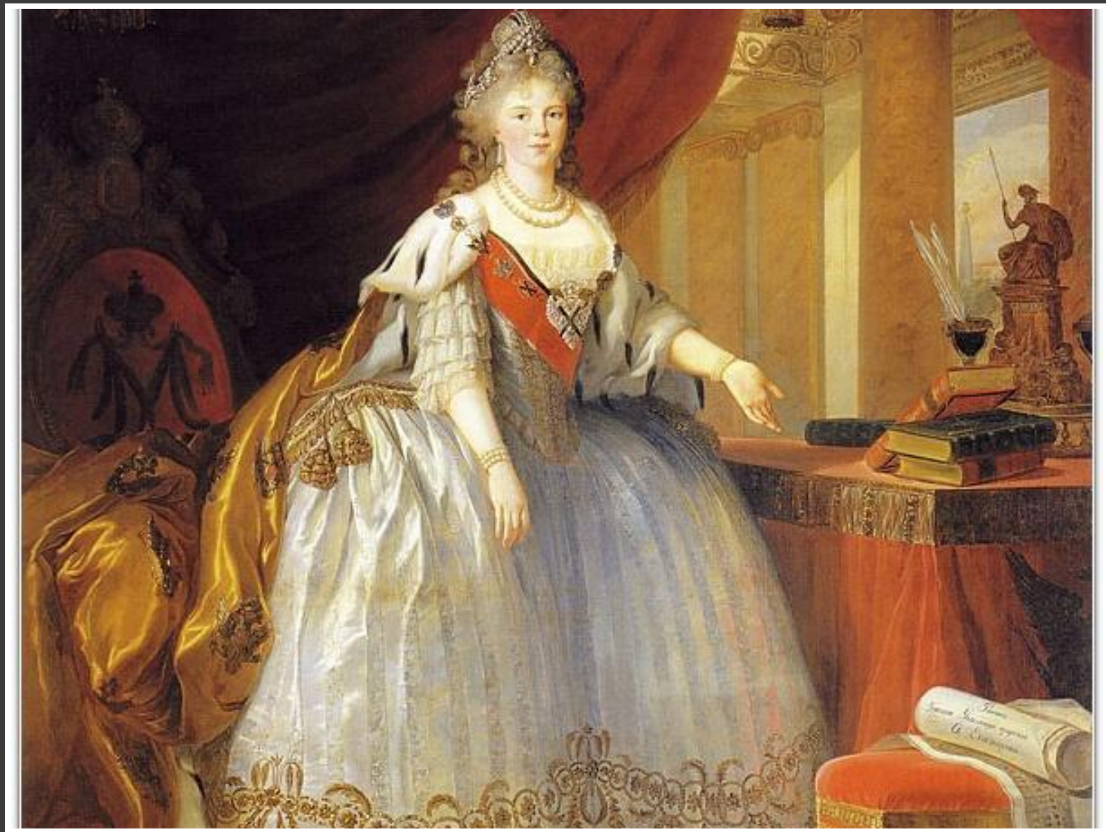
Большой парадный портрет императрицы Марии Фёдоровны.