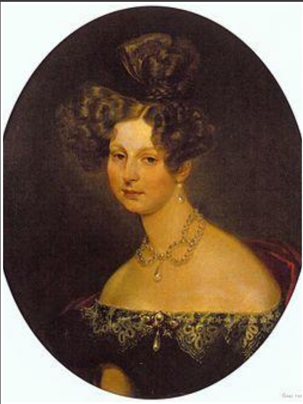
1829- 1830 гг. Портрет великой княгини Елены Павловны