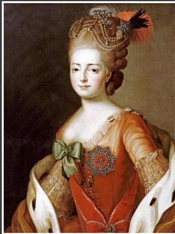
Великая княгиня Мария Федоровна