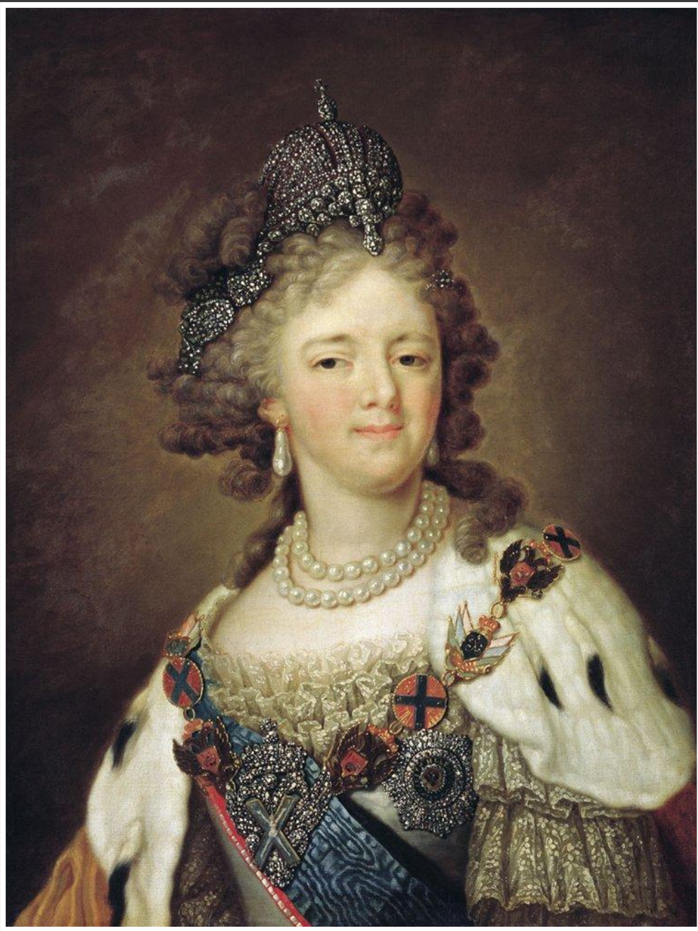
Неоклассицизм . XVIII в. 1790-е гг. Боровиковский Владимир Лукич. Портрет Марии Федоровны.