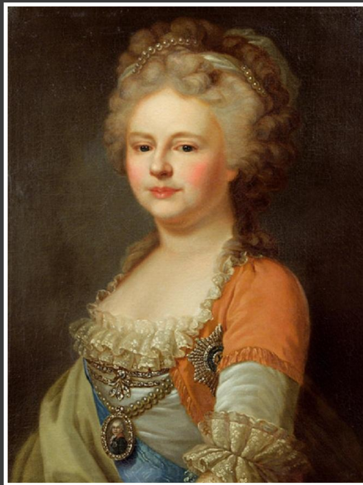
Ла́мпи - старший. Портрет императрицы Марии Федоровны.