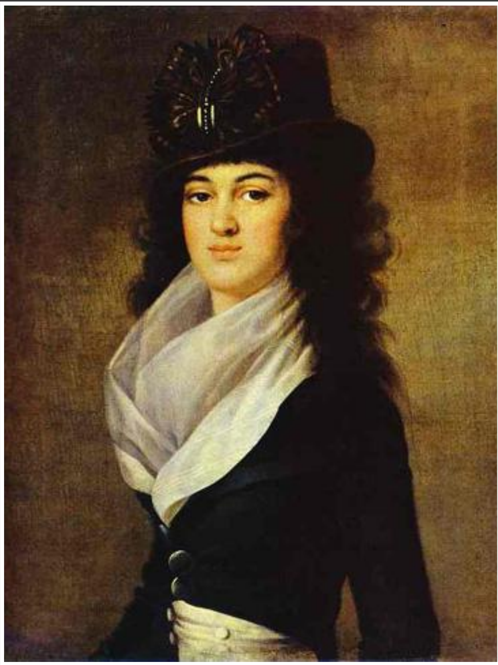
Неоклассицизм. Портрет княгини А.П. Гагариной, урожденной Лопухиной, Вуаль Жан Луи.