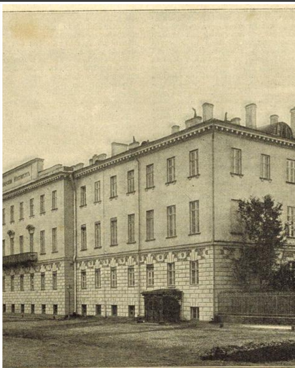
Катерининскаго женскаго института въ Петербургѣ. (По поводу столѣтія со дня его уч-

Закрытое сиротское учебное заведение для воспитания девиц среднего сословия, организованное и содержавшееся на средства императрицы Марии Федоровны.