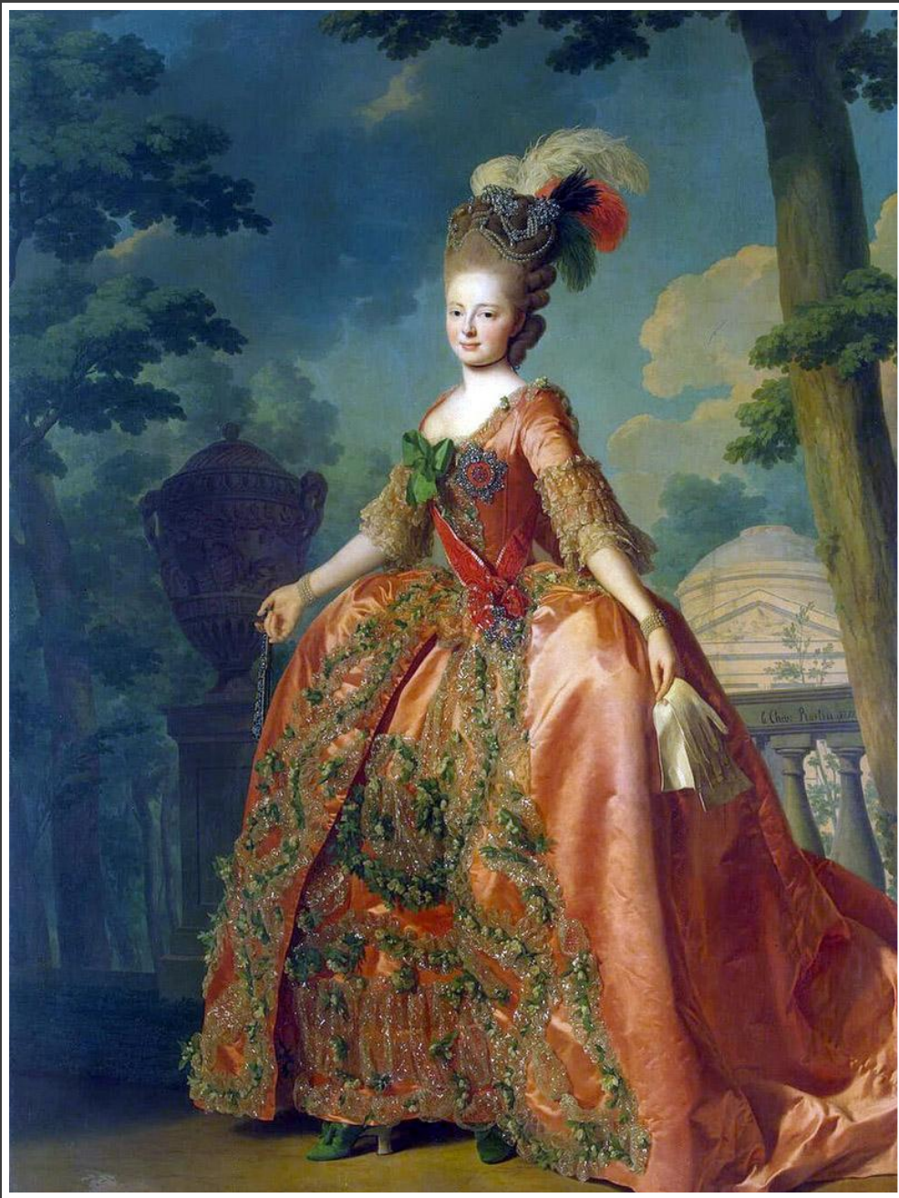
Портрет Великой княгини Марии Федоровны. А.Рослин, 1777 г.