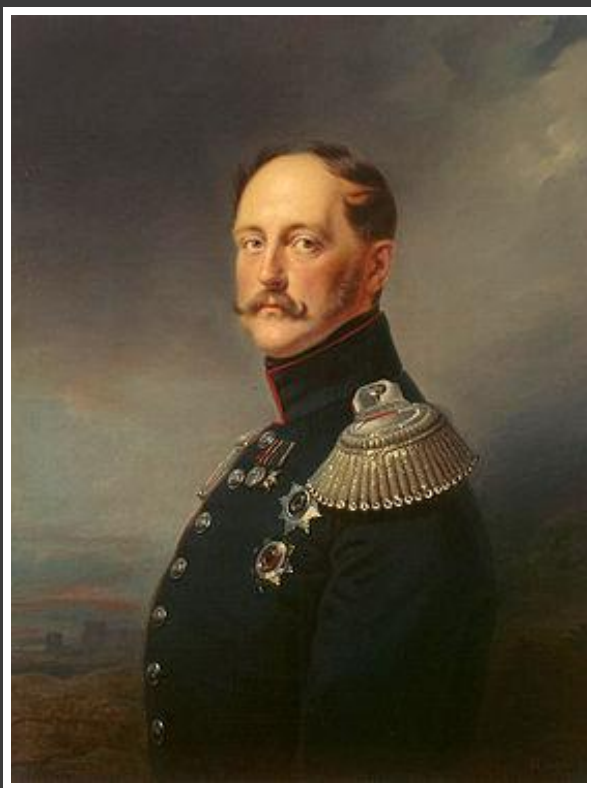
Никола́й I Па́влович- император Всероссийский , царь Польский и великий князь Финляндский