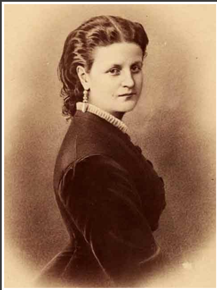
Екатерина Михайловна герцогиня Мекленбург-Стрелицкая. (1827-1894)