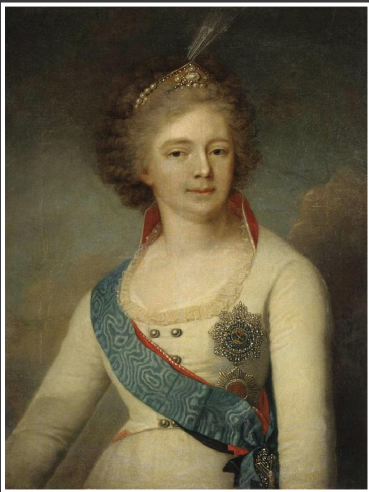
Боровиковский Владимир Лукич (1757—1825)