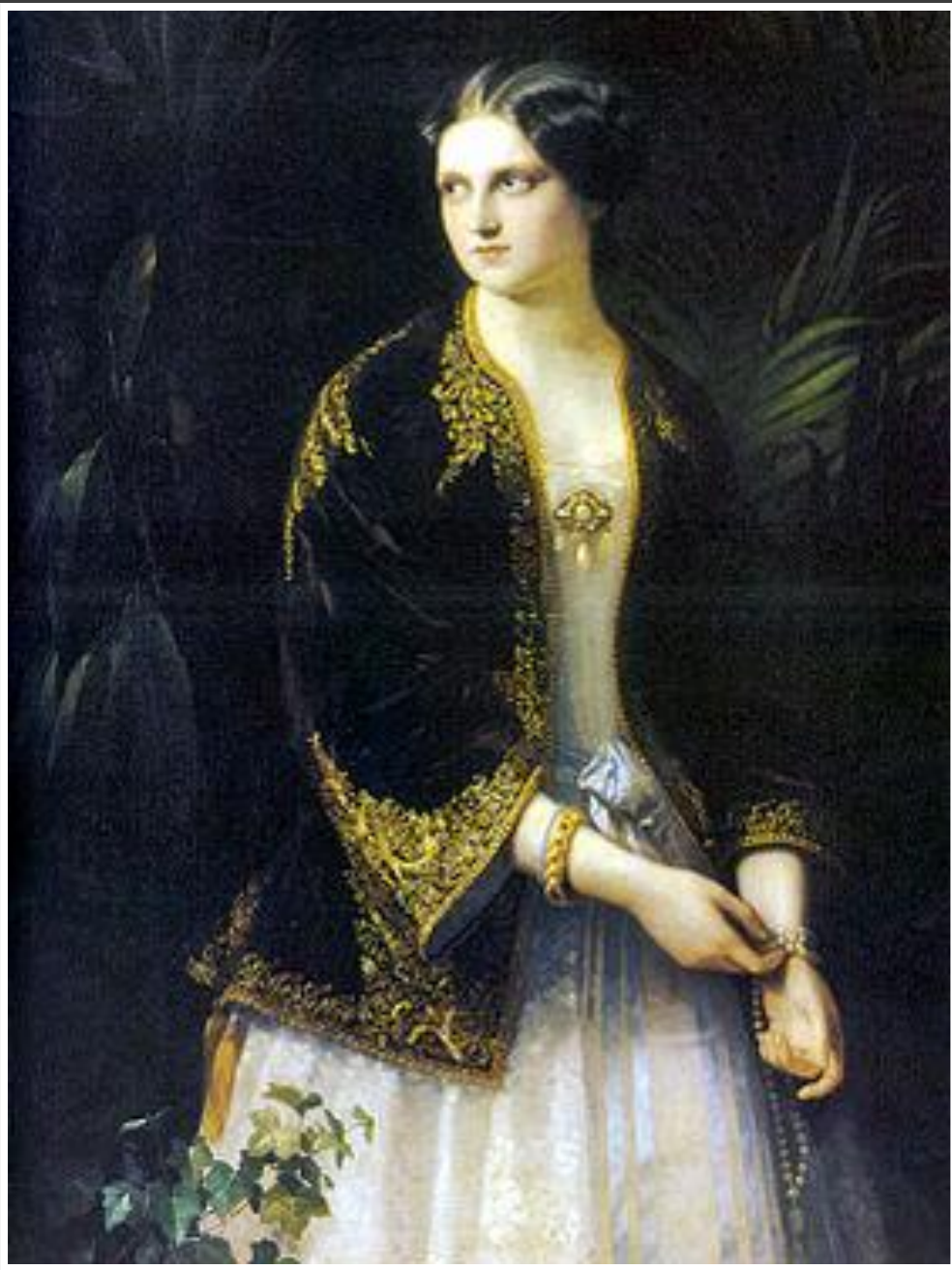
Екатерина Михайловна герцогиня Мекленбург- Стрелицкая.