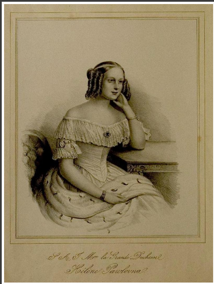
Портрет великой княгини Елены Павловны