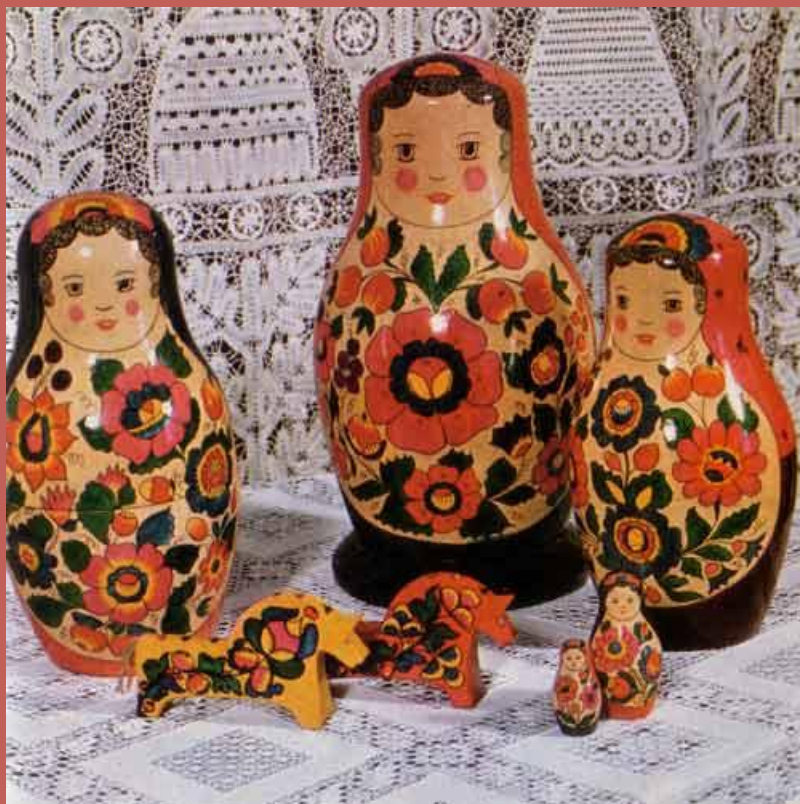
Полхово - майданская матрёшка