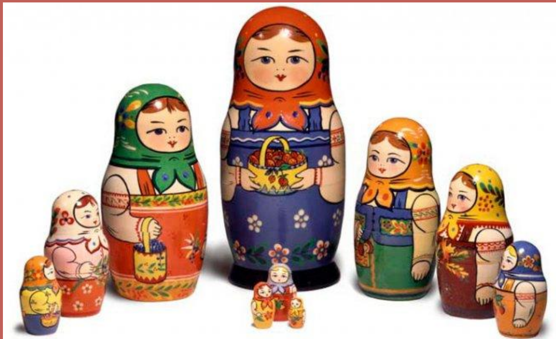
Матрёшки из Сергиева Посада ( загорские)

После появления первой матрёшки в разных районах России начали изготавливать и расписывать матрёшек, так понравилась им кукла Матрёна. И все они делали это по-разному.