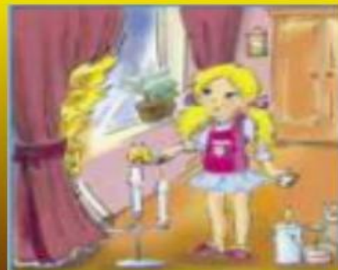
Игры с огнем