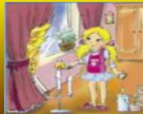
Игры с огнем