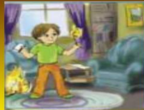
Неосторожное обращение с огнем