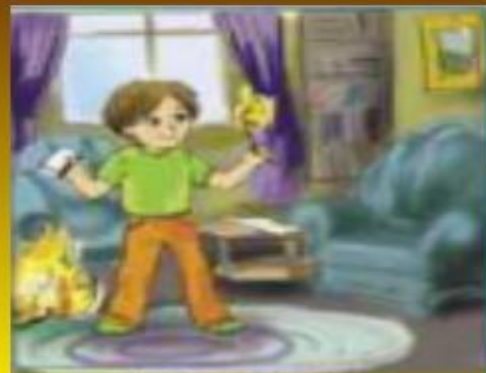
Неосторожное обращение с огнем