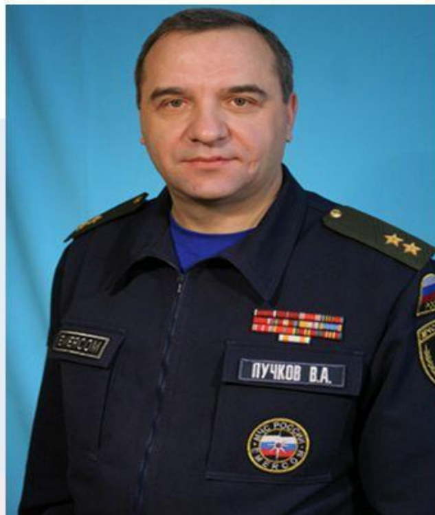
Владимир Андреевич Пучков

Министр Российской Федерации по делам гражданской обороны, чрезвычайным ситуациям и ликвидации последствий стихийных бедствий (с 21 мая 2012). Генерал-лейтенант запаса. Кандидат технических наук. Лауреат премии Правительства Российской Федерации.