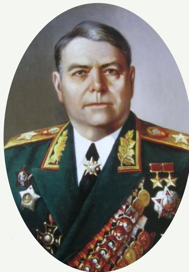
Василевский Александр Михайлович