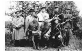
Партизаны отряда, вошедшего в состав просоветской Народной...