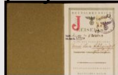
Германский паспорт, выданный Эрне "Саре"...