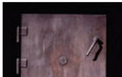
Копия двери газовой камеры в лагере Майданек