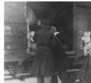
Депортация из пересыльного лагеря Вестерборк.