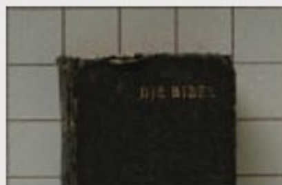
Библия, найденная при освобождении лагеря