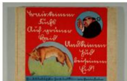
Антисемитская книга для детей