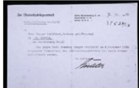
Извещение о казни Грегора Вольфарта