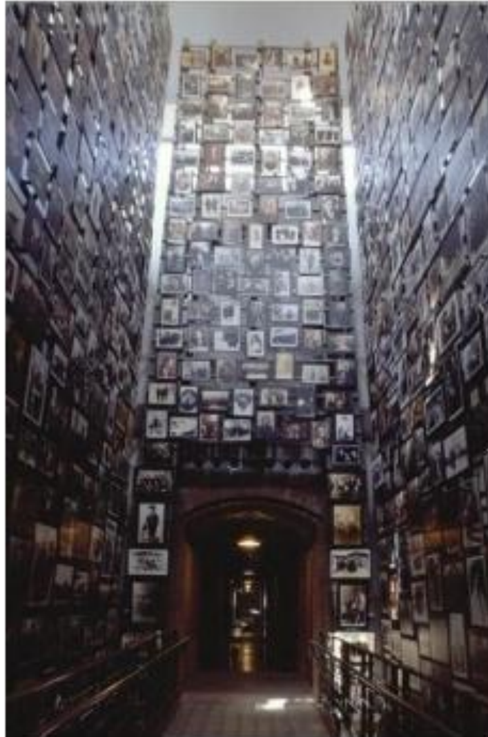
Башня лиц исчезнувших людей