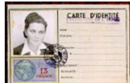
Фальшивое удостоверение личности: Симона Вайль