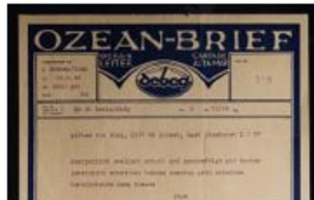
Радиограмма от Мориза Шёнбергера с парохода "С..."