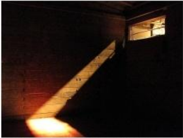
Товарный вагон. Фрагмент экспозиции.