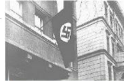
Еврейские юристы стоят в очереди, чтобы подать заявку...

27 января 1945 года советские войска вошли в лагерь Освенцим, расположенный на территории Польши. Эта советская военная хроника показывает детей, которые были освобождены из Освенцима советской армией. В годы существования лагеря многие дети из Освенцима подвергались медицинским экспериментам нацистского врача Йозефа Менгеле.