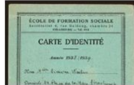
Фальшивый студенческий билет Симоны Вайль