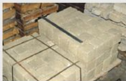
Гранит, добытый в Маутхаузене