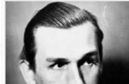
Писатель и актер, в 1937 году на 27 месяцев заключенный...