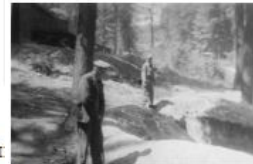
Двое уцелевших узников возле одной из ям с пеплом людей...