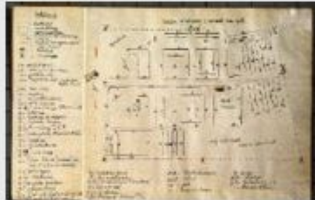
Нарисованный от руки план пересылочного лагеря Вест...