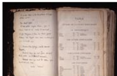
Библия пастора из Шамбон- сюр-Линьон, спасавшего евр...