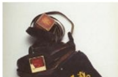
Религиозное облачение, найденное у заключенного, погибшего...