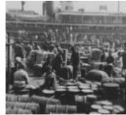
Еврейские беженцы в Германии высаживаются в порту...