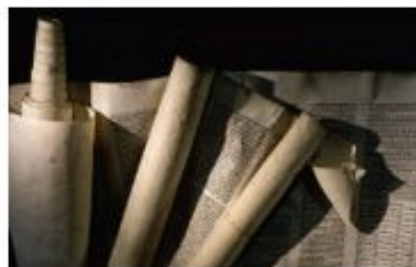
Оскверненные свитки Торы