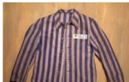
Форменная куртка заключенного, принадлежавшая Юлиану...