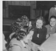
Еврейские женщины пережившие Холокост в санатории...