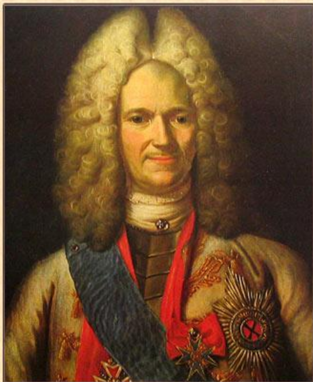
ПОРТРЕТ А. Д. МЕНШИКОВА. 1716—1720 ГГ., НЕИЗВЕСТНЫЙ ХУДОЖНИК

Меншиковский дворец , расположенный на Университетской наб., д.15, сохранившийся до нашего времени, является частью обширной усадьбы первого Генерал-Губернатора Санкт-Петербурга – Александра Даниловича Меншикова (1673-1729). Меншиков, сделав прекрасную карьеру, всегда оставался близким другом и соратником Петра I. Пост генерал-губернатора Санкт-Петербурга занимал с 1703 по 1724 год.