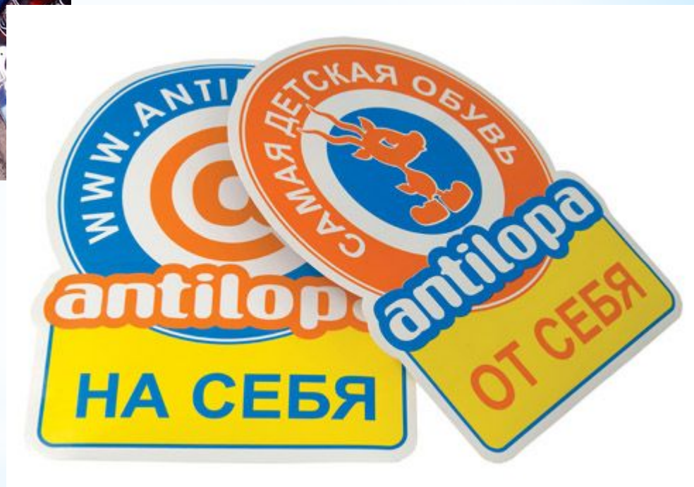
Стикер «Тяни-толкай» (от себя/к себе)