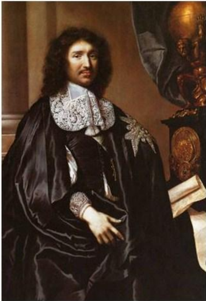
Жан Батист Кольбер