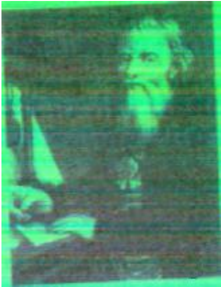
И. П. Кулибин (1735-1818).

И. П. Кулибин выдающийся русский механик изобретатель, более тридцати лет руководил механической мастерской Петербургской академии наук.