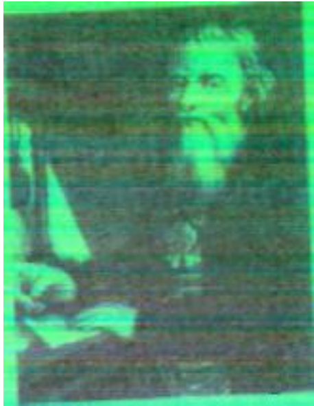
И. П. Кулибин (1735-1818).

И. П. Кулибин выдающийся русский механик изобретатель, более тридцати лет руководил механической мастерской Петербургской академии наук.