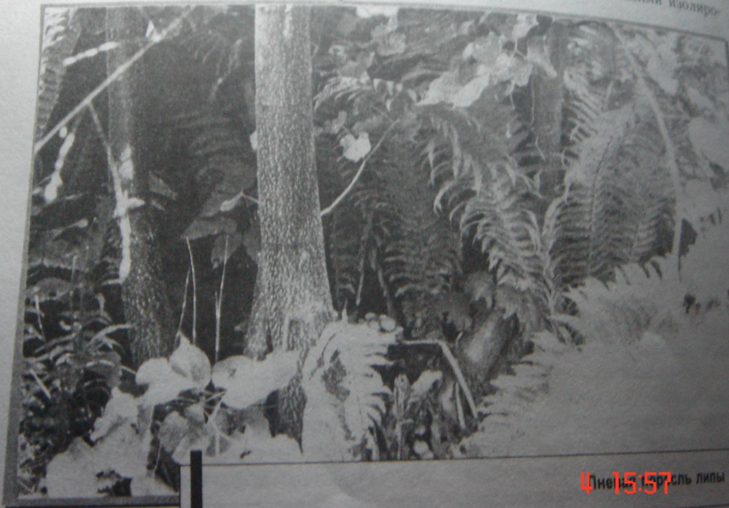
Общий вид лесонасаждений липы после вспышки грибковых заболеваний

ареал липы сибирской был значительно шире. Об этом свидетельствуют местонахождения липы небольшими изолиро-