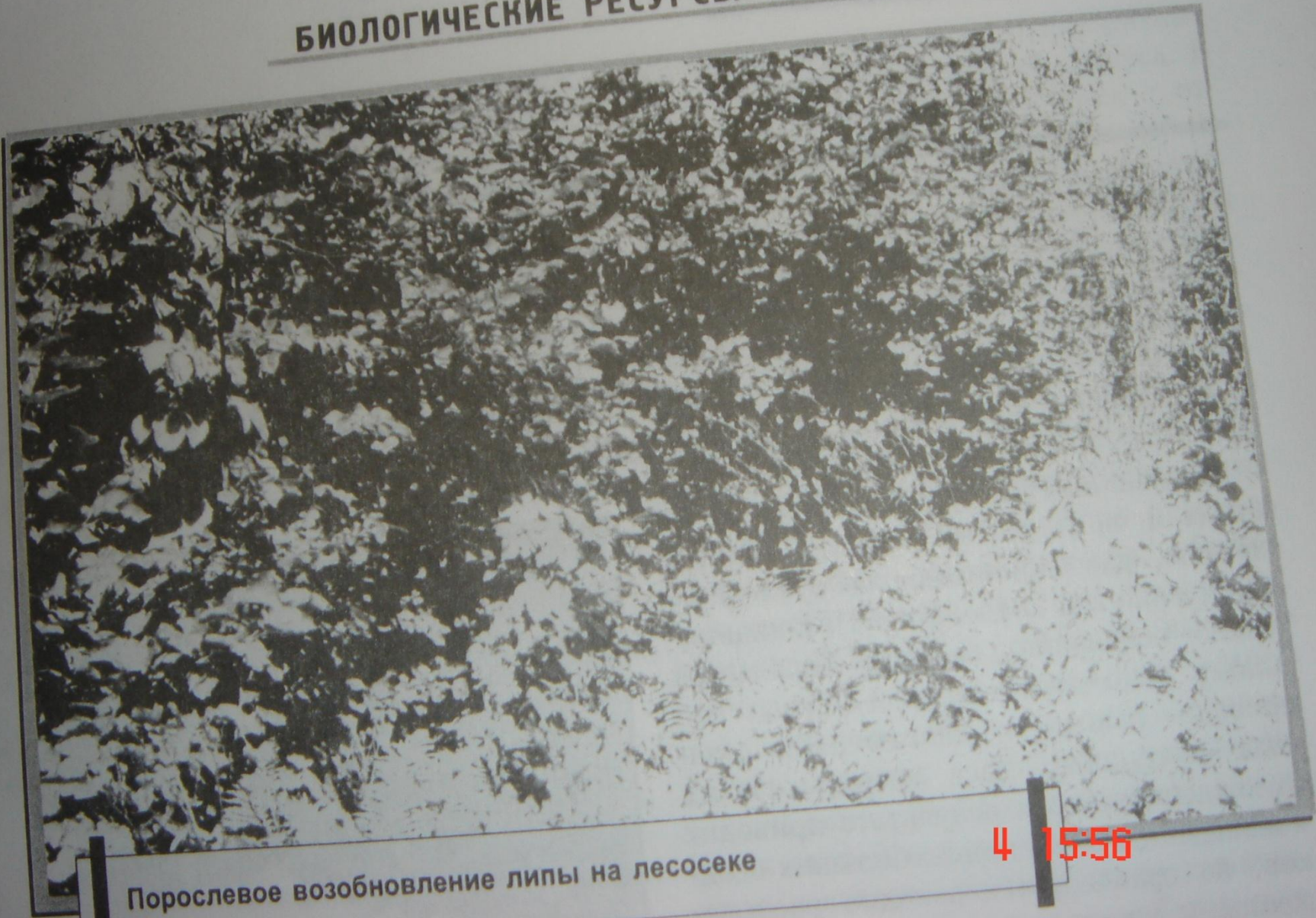
Порослевое возобновление липы на лесосеке