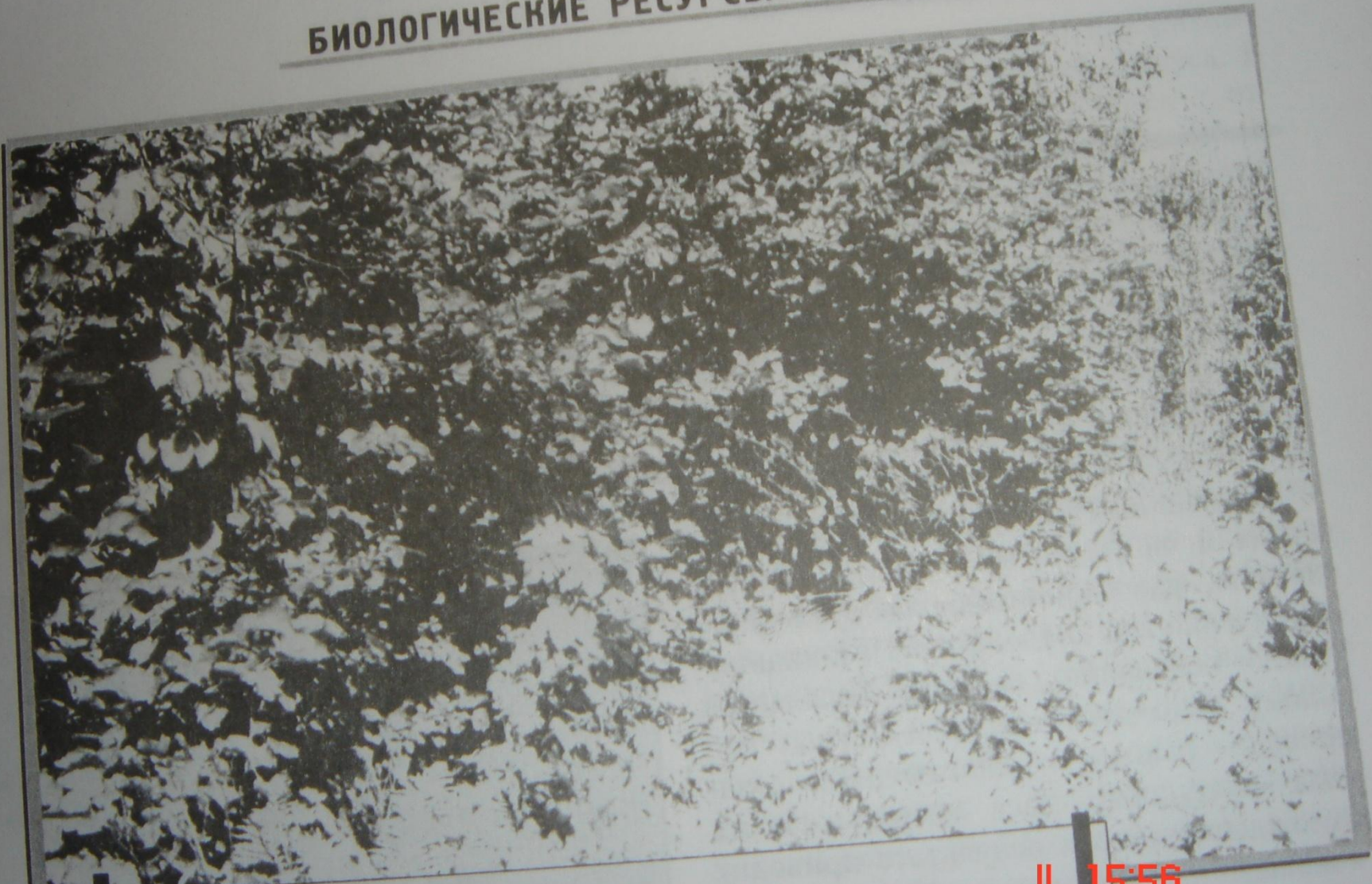
Порослевое возобновление липы на лесосеке