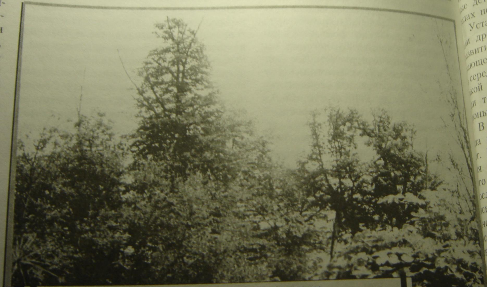
Общий вид лесонасаждений липы после вспышки грибковых заболеваний