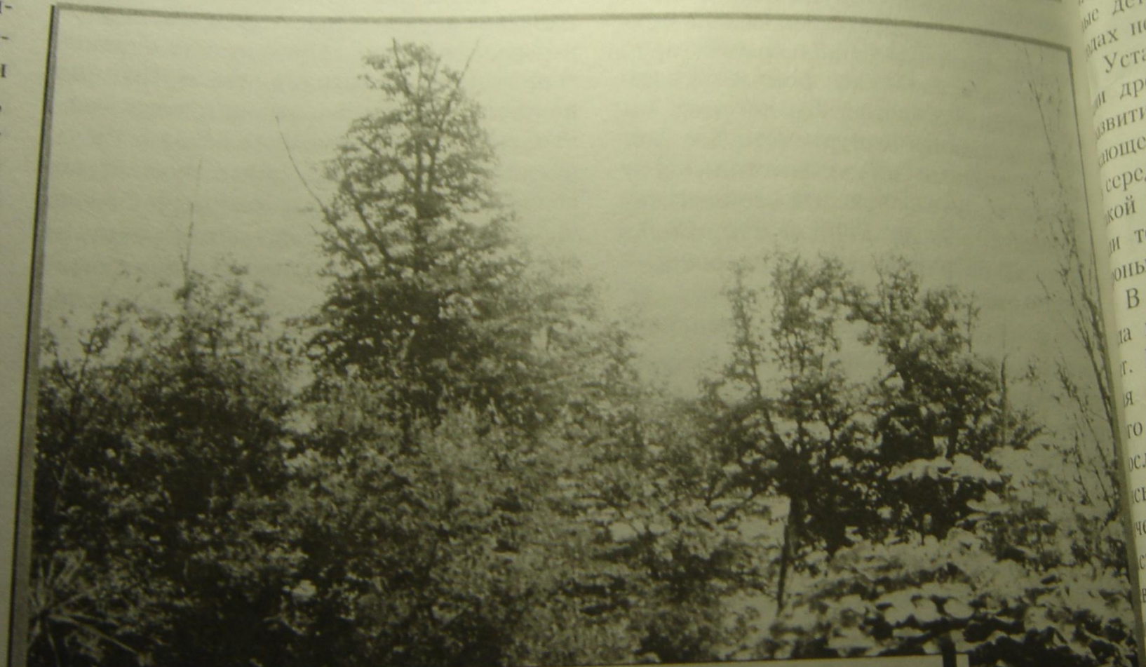
Общий вид лесонасаждений липы после вспышки грибковых заболеваний