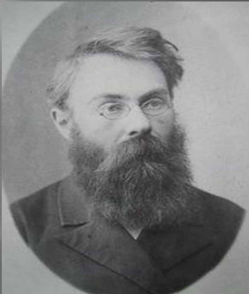
Порфирий Никитович Крылов