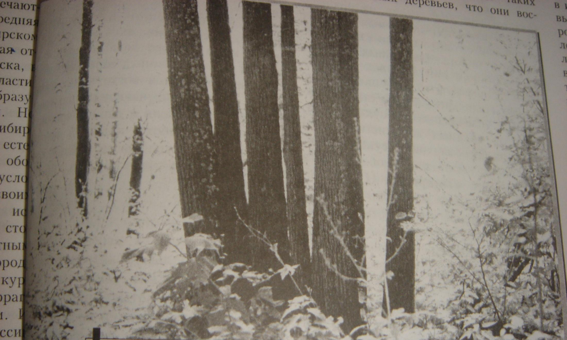
«Куст» из 6 стволов липы 40-летнего возраста, выросшей из одного пня