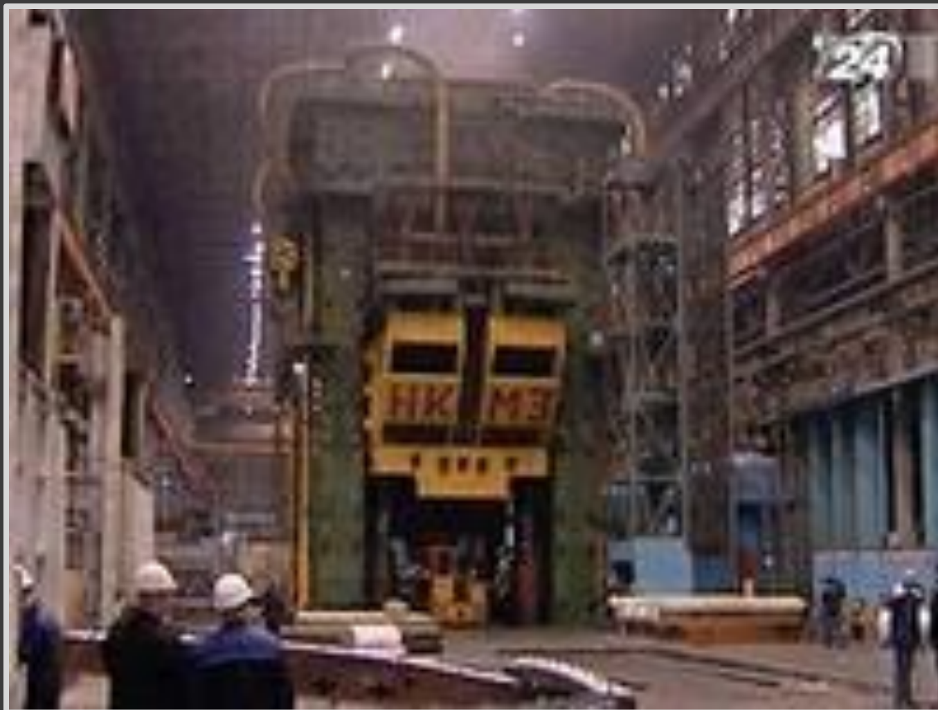
75-итонный пресс- гордость завода.