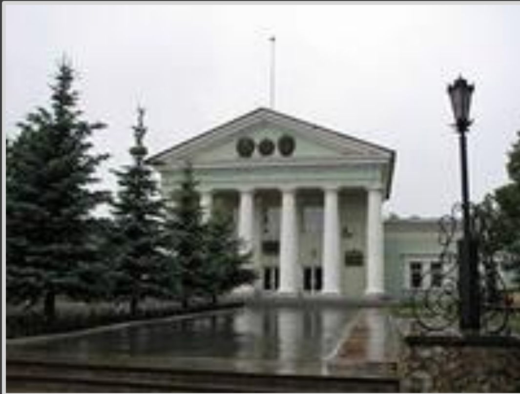
Центральная проходная ВСМПО-Ависма.