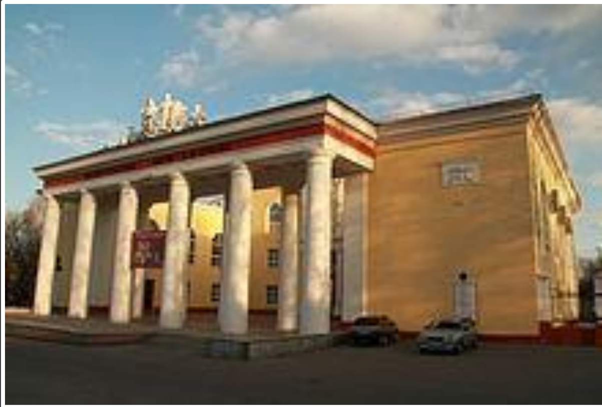
Дворец культуры имени Г.Д. Агаркова