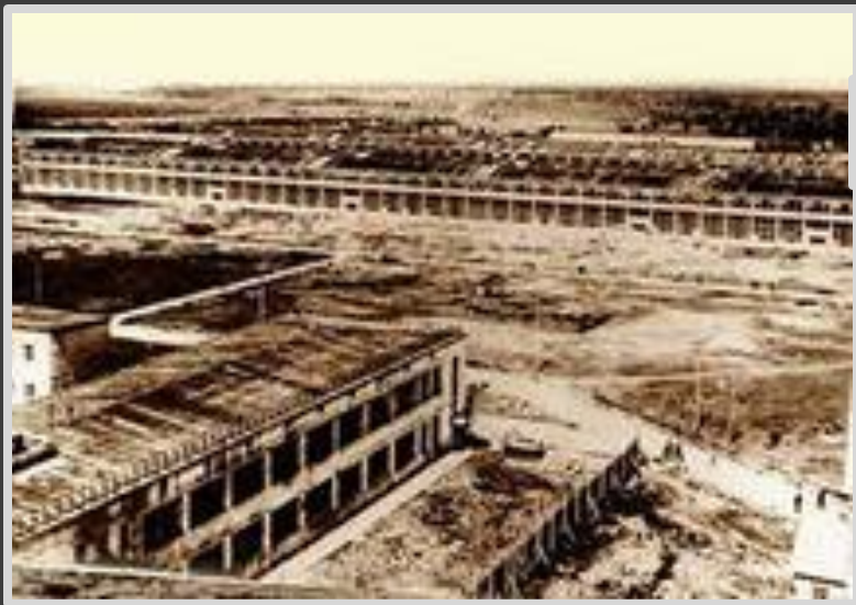
ВСМПО в 1937 году.