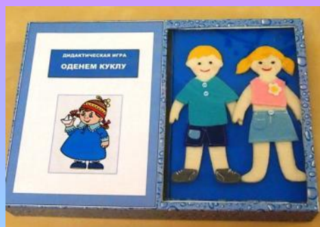
Дидактическая игра «Одень куклу»