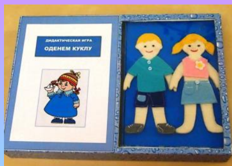
Дидактическая игра «Одень куклу»