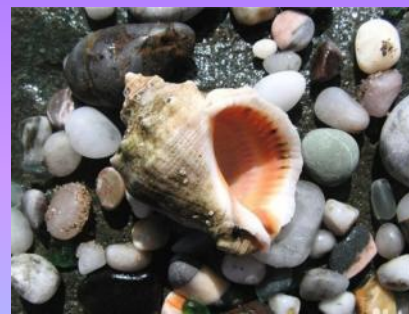
Камни и ракушки