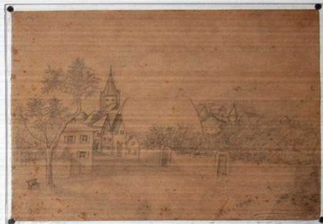
Рисунки Вити Коробкова.