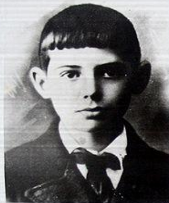
Коробков В.М., 1929 г. рождения, пионер, разведчик штаба 3 бригады Восточного соединения партизан Крыма, 9 марта 1944 г. расстрелян фашистами.