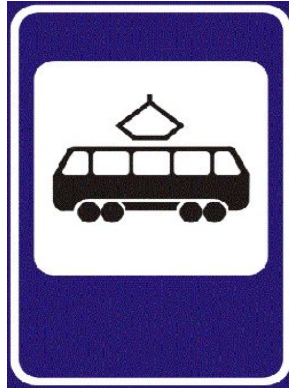
Место остановки трамвая

Ждать транспорт надо на специальных остановках