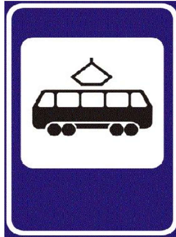
Место остановки трамвая

Ждать транспорт надо на специальных остановках