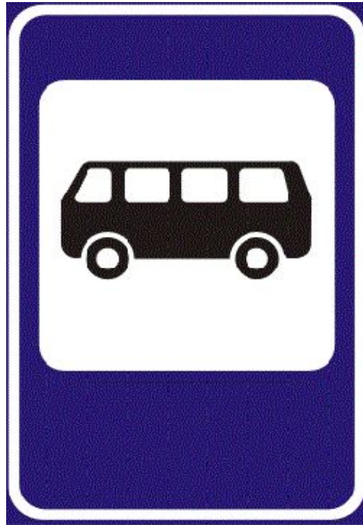
Место остановки автобуса