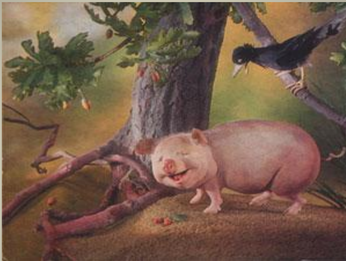
«Свинья под дубом»