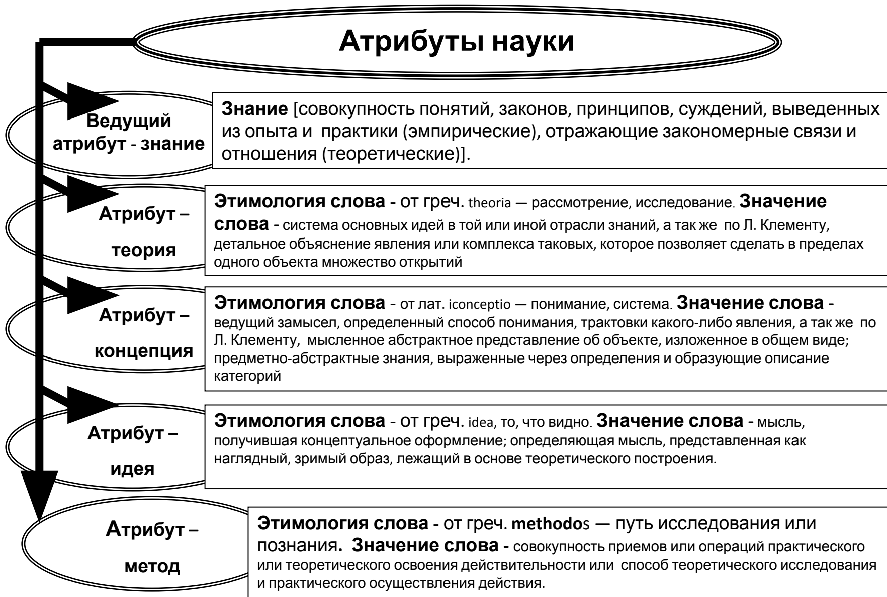
Рис. 14. Атрибуты науки