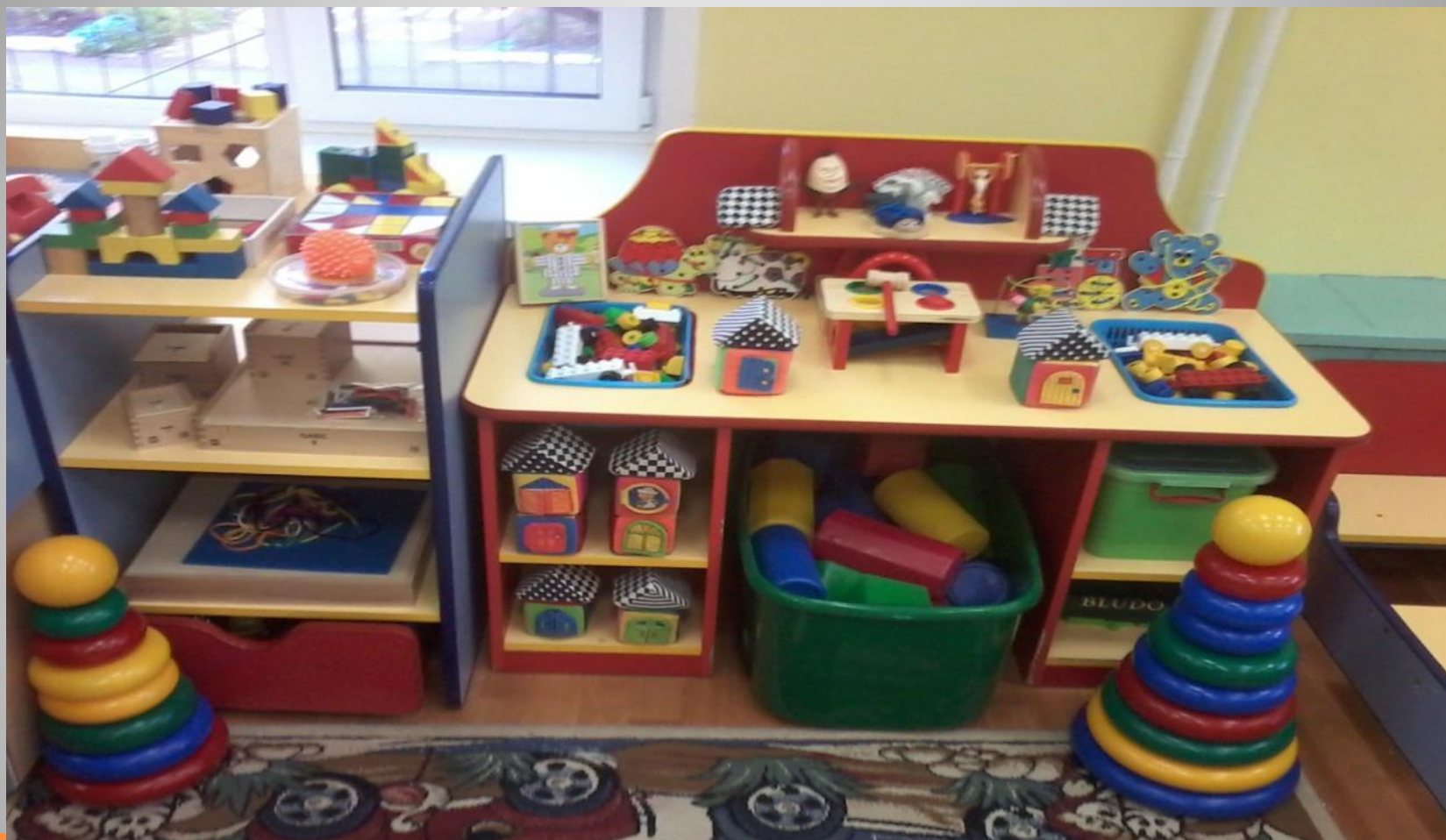
Уголок конструирования и строительства