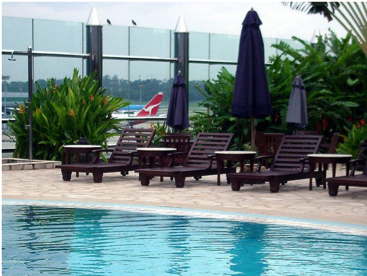
Бассейн в транзитной зоне Терминала 1