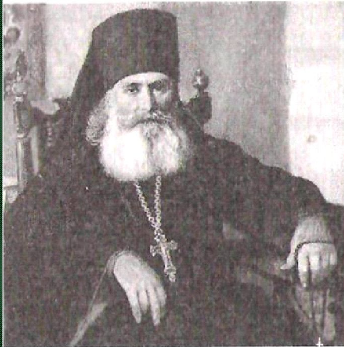
АРХИМАНДРИТ МАРТИРИЙ (Островой)