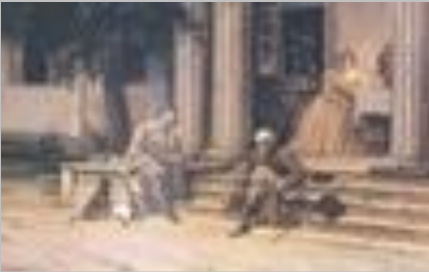
М.В. Гоголь у Яновщині