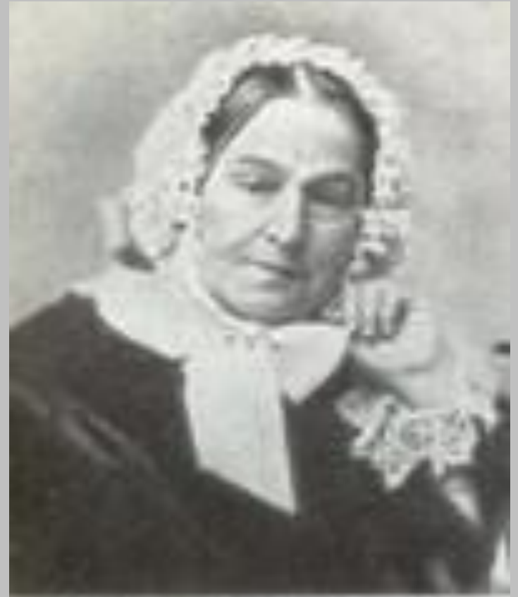
Марія Іванівна Гоголь. Фотографія.