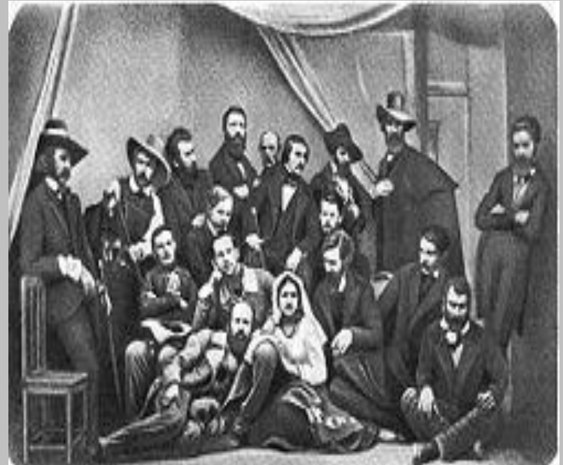
М.В. Гоголь з російськими художниками в Римі. 1845 р.