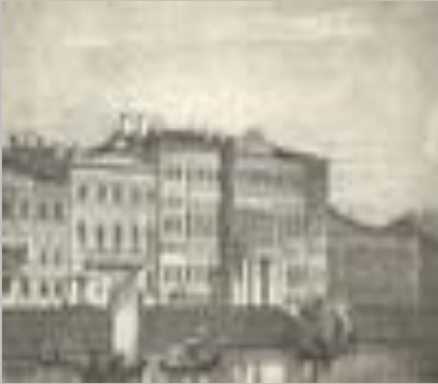
Департамент наділів у Петербурзі, де служив Гоголь у 1830-1831 р.р. Гравюра. 1834.