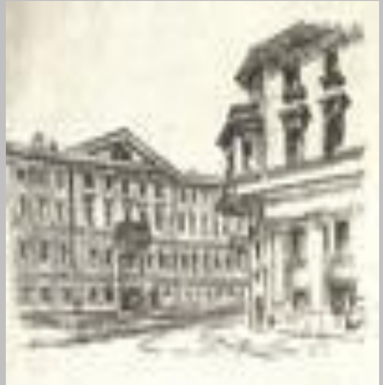
Будинок каретника Іохіма на Великій Міщанській вулиці в Петербурзі, де жив М.В. Гоголь в 1829 р. Автолитографія Е. Бернштейна. 1951.