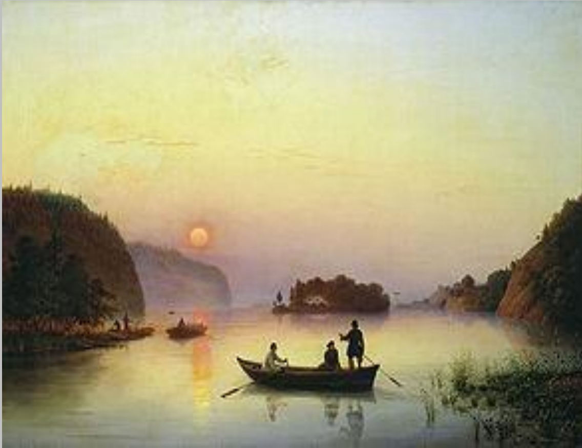
Переправа Гоголя через Дніпро