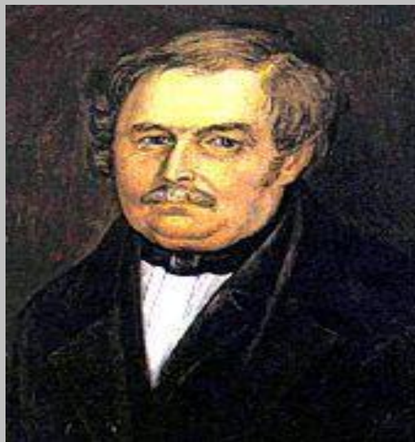
Василь Опанасович Гоголь- Яновський (1777 - 1825)