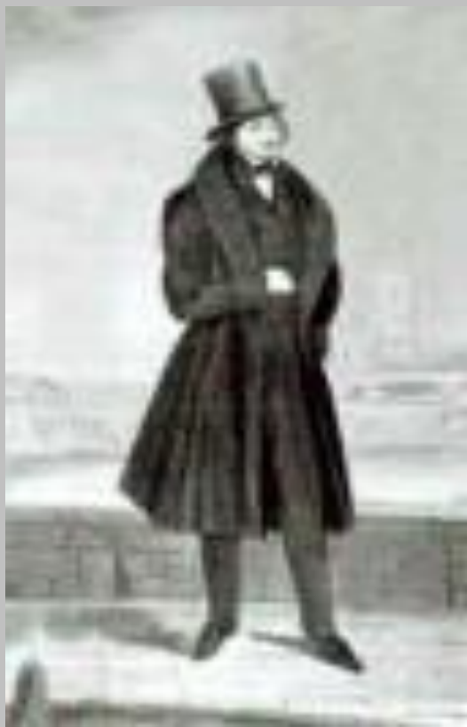
Портрет работи Горюнова.

«Все свои ныне печатные грехи я писал в Петербурге, и именно тогда, когда я был занят должностью, когда мне было некогда, среди этой живости и перемен занятий, и чем я веселее провел канун, тем вдохновеннее возвращался домой, тем свежее у меня было утро».