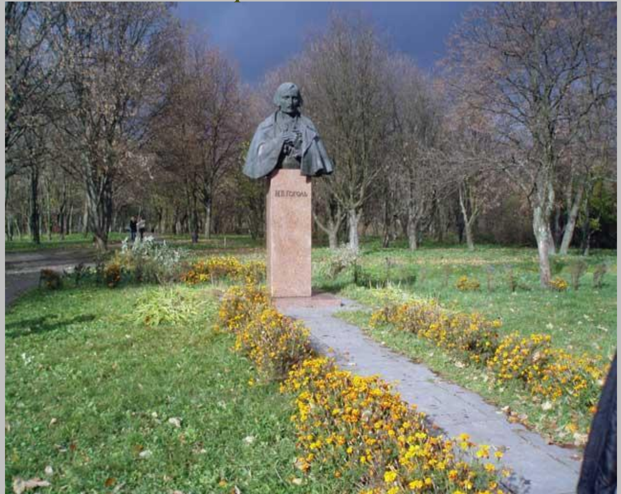
Бюст М.В.Гоголя Автори О.Ковальов і В.Шевченко

У селі Гоголево на Полтавщині, на батьківщині М.В.Гоголя, з нагоди 175-річчя з дня народження письменника, 1 квітня 1984 року, відкрили заповідник- музей.