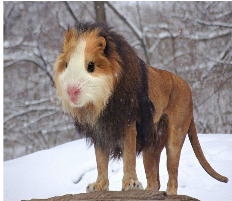
Мутацияға ұшыраған Арыстан