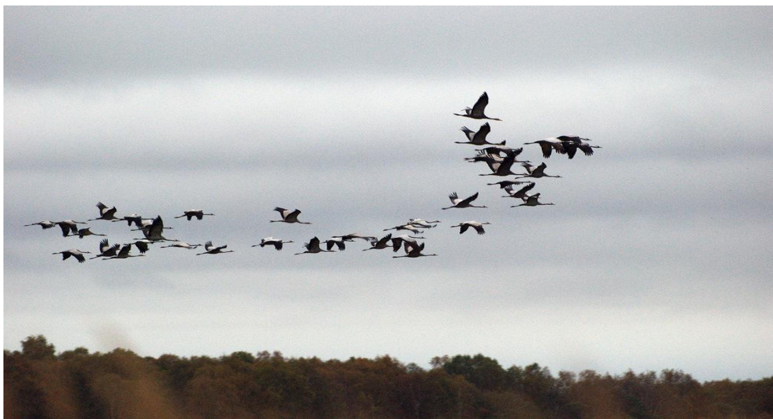
Тырнарлардың жылы жаққа ұшуы

Топтанып орналасу популяция үшін қолайсыз жағдайларда үлкен тұрақтылық береді. Жануарлардың ортаның қолайсыз жағдайларына немесе олардың даму циклдарына байланысты жылжып қозғалуын миграция деп атайды. Мысалы, құстардың жылы жаққа ұшуы маусымдық миграцияға жатады.