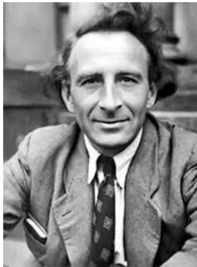
Н.В. Тимофеев-Ресовский (1900-1981)

Микроэволюция терминін 1938 жылы ғылымға енгізген Ресей ғалымы Н.В. Тимофеев-Ресовский .