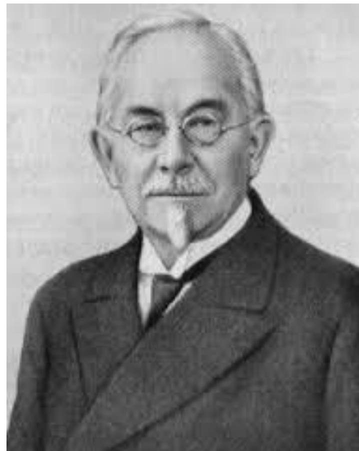
В.Иогансен (1857 – 1927)

Популяция терминін 1903 жылы Дания биологы В.Иогансен енгізді.