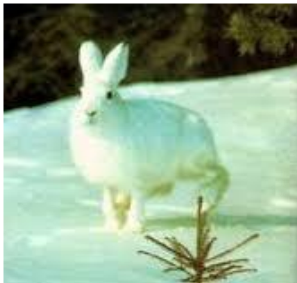
Ямал түбегін мекен ететін ақ қоян

Мысалы, Ямал түбегіндегі ақ қояндардың аш ішектерінің ұзындығы Орал тауының орманды далаларындағы өкілдеріне қарағанда 2 есе ұзын. Бұл қоректену ерекшеліктеріне, қорек құрамындағы қатты азықтардың мөлшеріне байланысты.