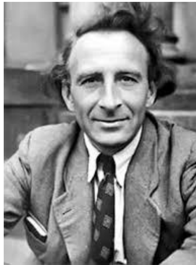
Н.В. Тимофеев-Ресовский (1900-1981)

Микроэволюция терминін 1938 жылы ғылымға енгізген Ресей ғалымы Н.В. Тимофеев-Ресовский .