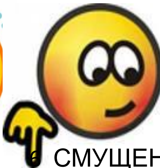
6 СМУЩЕНИЕ 7 РАДОСТЬ