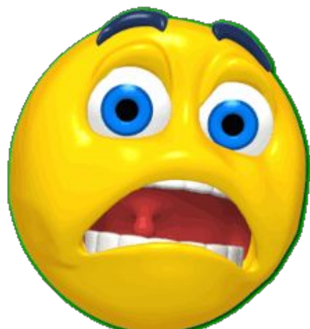
4 СТРАХ ИСПУГ