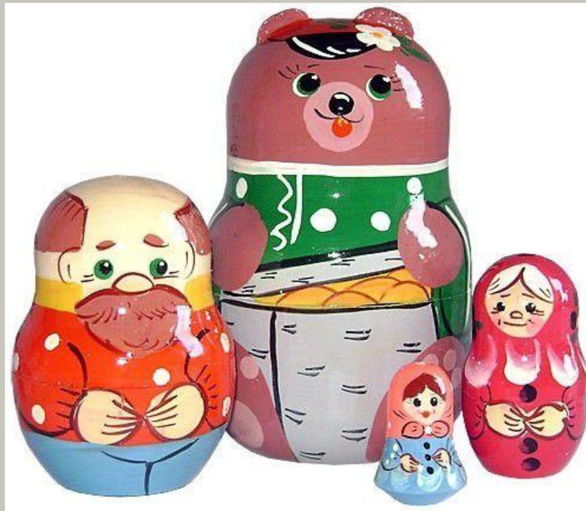
«Маша и медведь»