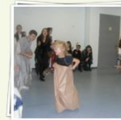
Школьный Новый год