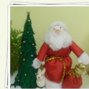
Муниципальный конкурс "Мастерская Деда Мороза"