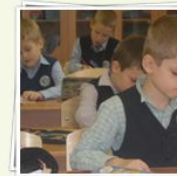
Наша школьная жизнь. 1 класс. Мы на уроках.