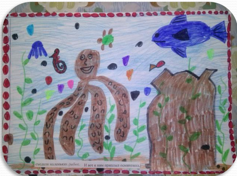
съедали маленьких рыбок. И вот к ним приплыл осьминожка,