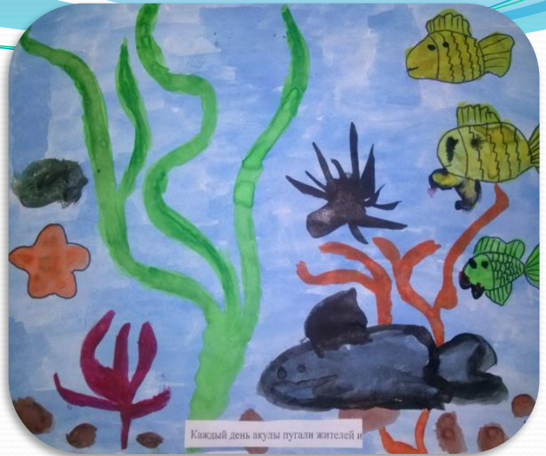
Каждый день акулы пугали жителей и...