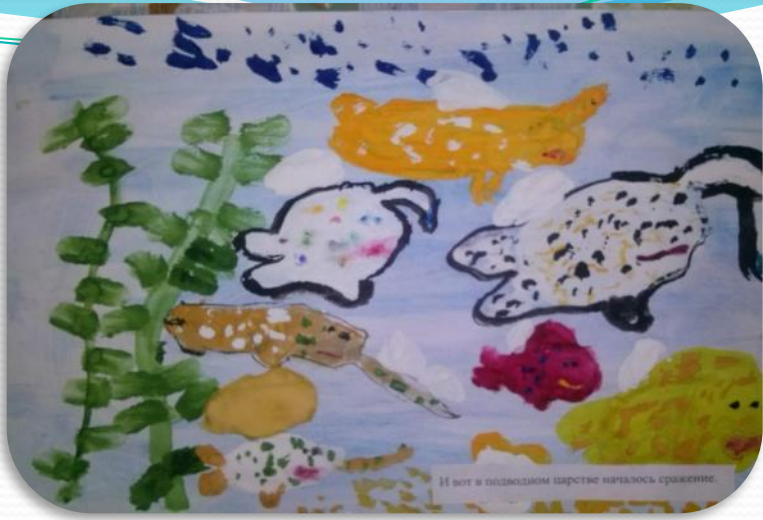
И вот в подводном царстве началось сражение.