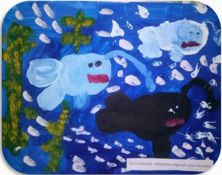
Долго воевали обитатели морского дна с акулами.