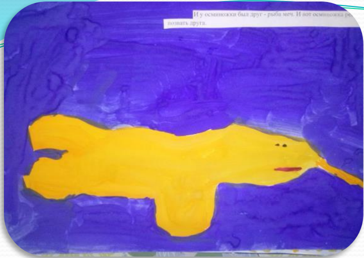
И у осьминожки был друг - рыба меч. И вот осьминожка решила позвать друга.