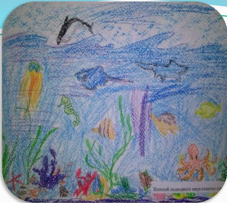
Жителей подводного мира охватила ст...