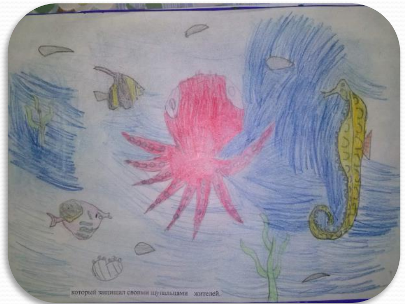
который защищал своими щупальцами жителей.