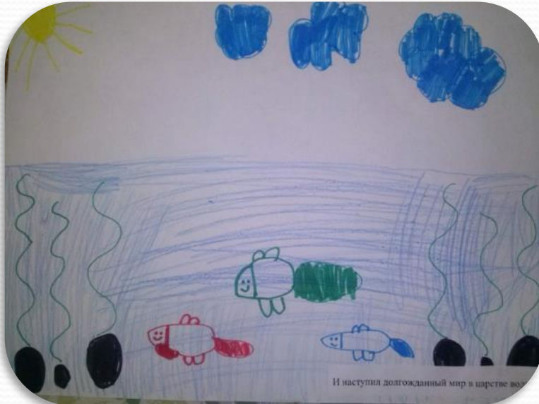
И наступил долгожданный мир в царстве вод.