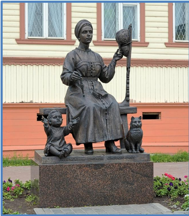
Скульптура «Русским женам – берегиням домашнего очага»

Женщина-поморка, в традиционном русском костюме, сидит за прялкой с веретеном в руках. Рядом – ребенок и кот.