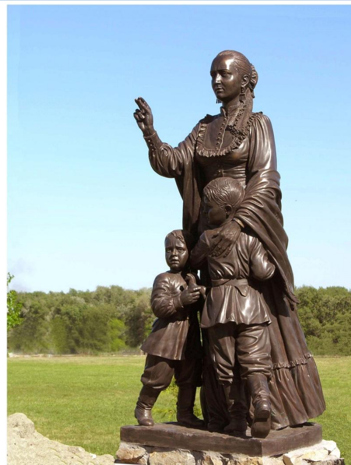
Казачьему Роду нет переводу(мать-казачка)

Застыли в бронзе мать и её двое сыновей. Мать, сложившая пальцы для крестного знамения, защищает своих детей силою веры и материнской любви.