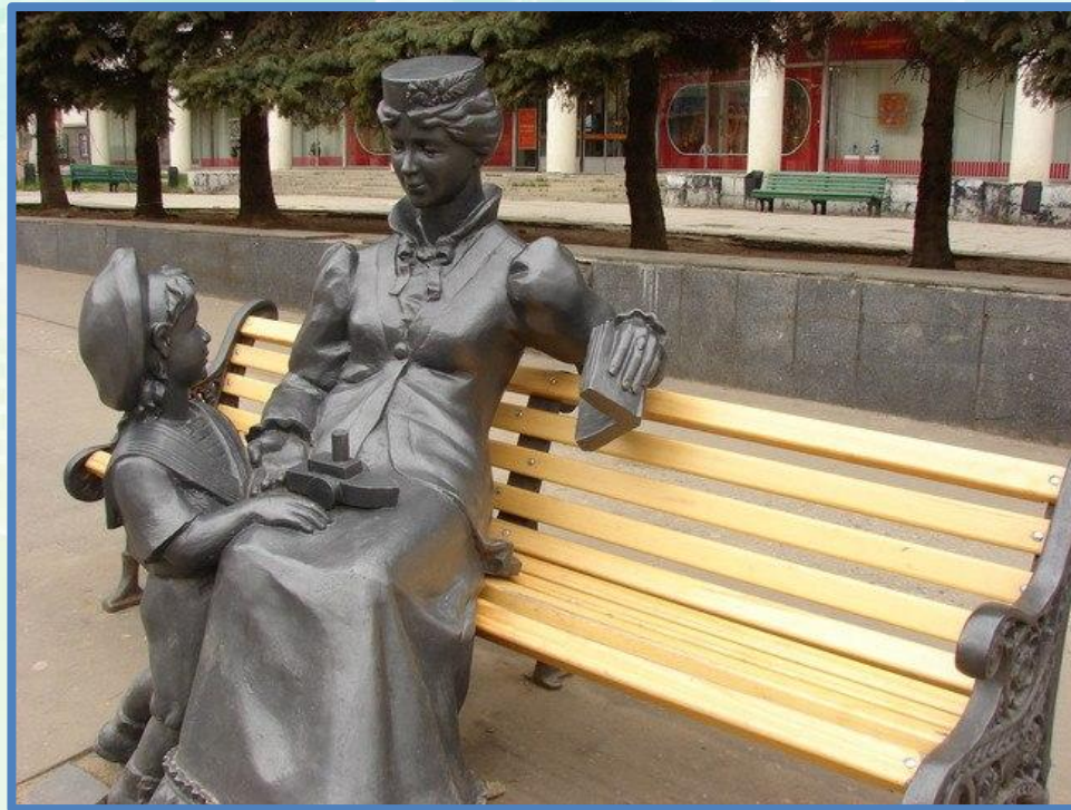
«Мама с сыном»

Композиция изображает сидящую на скамейке женщину с книгой в руке, рядом стоит мальчик с игрушечным корабликом.