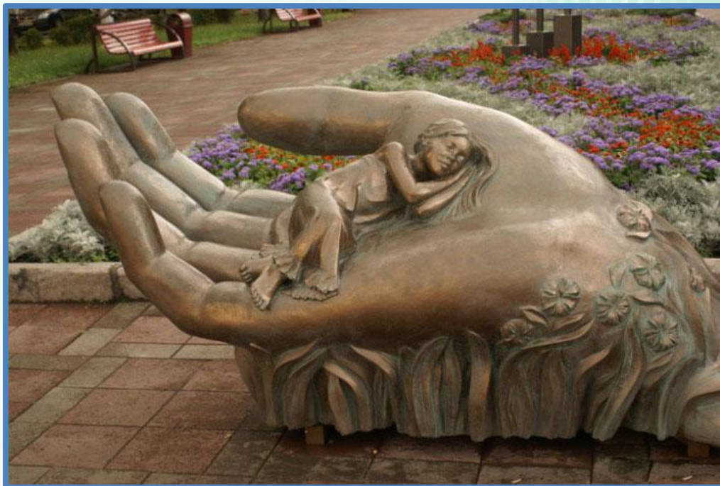
«Рука, качающая колыбель»

Скульптура в виде ладони, на которой дремлет утомленное негой дитя... По задумке авторов работы, эта композиция должна стать символом признательности всем матерям, оберегающим, лелеющим и воспитывающим своих детей. Ведь «рука, качающая колыбель, правит миром».