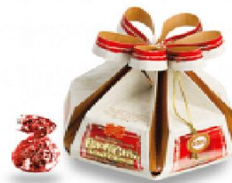
Белорусская картошка 380 г.