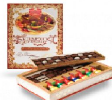
Белорусский сувенир 890 г.