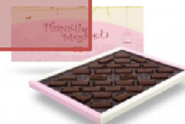
Подарочные конфеты «Птичье молоко» 320 г.