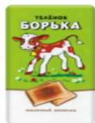
Телёнок Борька 100 г.