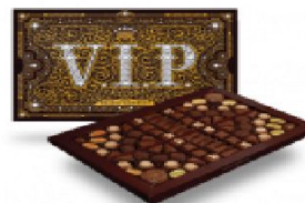
Компюлек (дл.) 950 г.