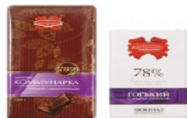
Коммунарка горький с какао-крупкой 100г., 50г.