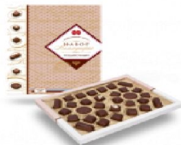
Компюлек 300 г.