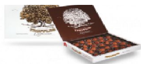
Подарочный конфеты «Трюфель капучино» 360 г.