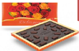
От всей души 270 г.