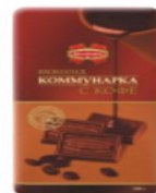
Шоколад «Коммунарка» с кофе 100 г.