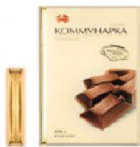
Коммунарка молочный 200 г.