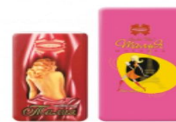
Талия 100г., 50г.