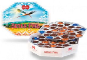
Белая Русь 635 г.