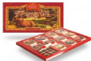
Беловежская пуца 1060 г.