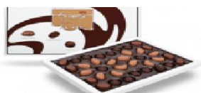
Подарочный набор шоколадных конфет «Ассорти» 380 г.