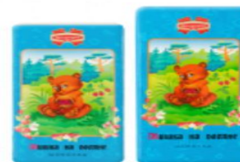
Мишка на поляне 100г., 50г.