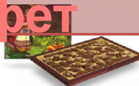
Папараць-кветка 370 г.