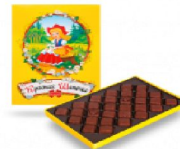
Красная Шапочка 300 г.