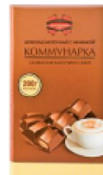
Коммунарка с шоколадной начинкой 200 г.