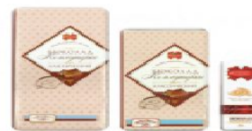
Коммунарка классический 100г., 50г., 20г.