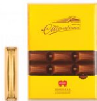
Столичный Элит 200 г.