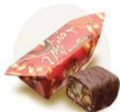
«Грильяж на арахисе»