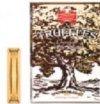
Трюфельный Элит 200 г.