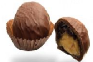
Monte вкусослива с цукатами