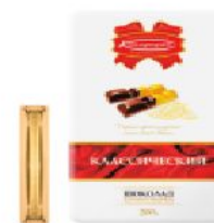
Коммунарка классический 200 г.