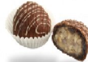
Monte вкусослива с фундуком и сливками