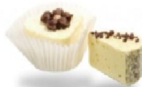
Monte воздушный с кокосовой стружкой