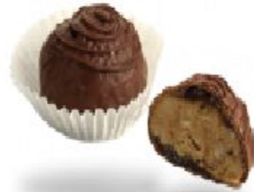
Monte вкусослива с фундуком и медом