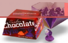
От кутюр с какао крупкой 170 г.