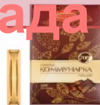
Коммунарка горький 200 г.