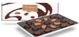
Подарочный набор шоколадных конфет «Ассорти» 190 г.