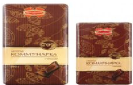
Коммунарка горький 100г., 50г.