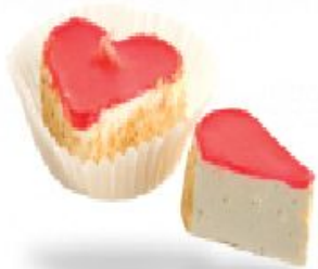
Monte воздушный с желе