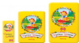
Красная шапочка 100г., 50г., 20г.