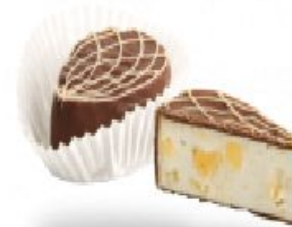
Monte воздушный с цукатами