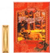
Беловежская пуща Элит 200 г.