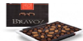
Подарочный набор шоколадных конфет «Браво, оркестр!» 380 г.