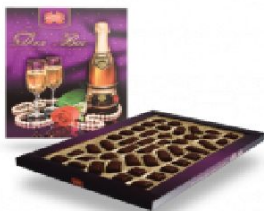
Для Вас 480 г.