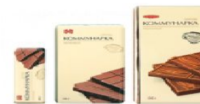
Коммунарка молочный 100г., 50г., 20г.