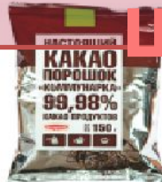
Какао-порошок Коммунарка 150 г.