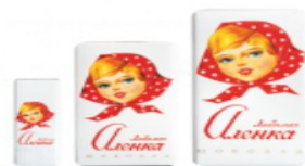
Любимая Аленка 100г., 50г., 20г.