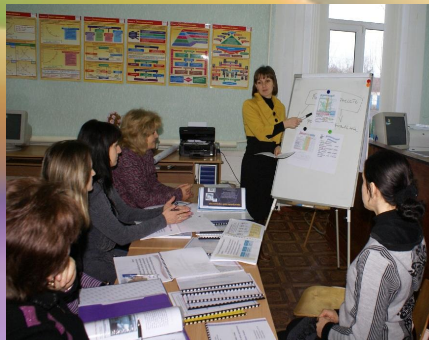
← Педагогічні читання