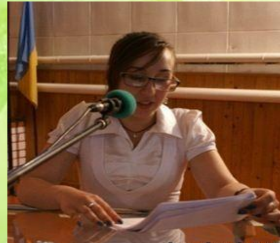
Захист учнівських проєктів під час уроків та ліцейної науково-практичної конференції