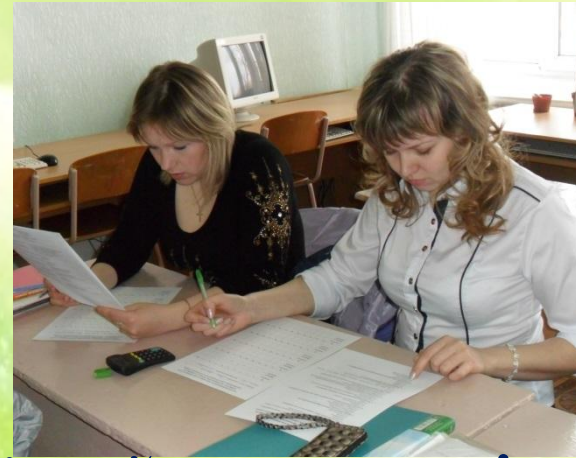
Конкурси фахової майстерності